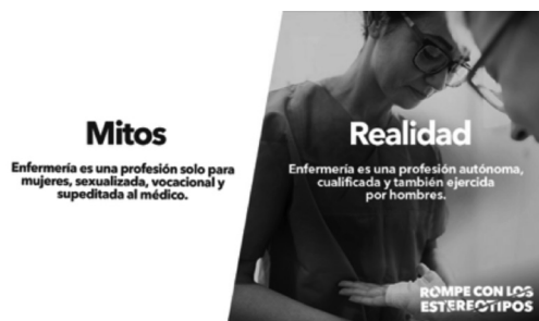
Imagen 9 · Campaña Satse (2018)

como profesionales y como mujeres y como ha ido en aumento «mostrando una imagen de la enfermería sexualizada y estereotipada» (Tribuna Feminista, 2018).