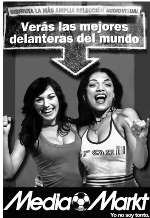
Imagen 11 · Campaña Media Markt (2016)

los casos recogidos referidos a marcas menores y, por lo tanto, con una menor difusión. En el caso del Observatorio, el último caso recogido data de 2016, siendo un cartel de una concentración de motos de carácter local (Imagen 12),