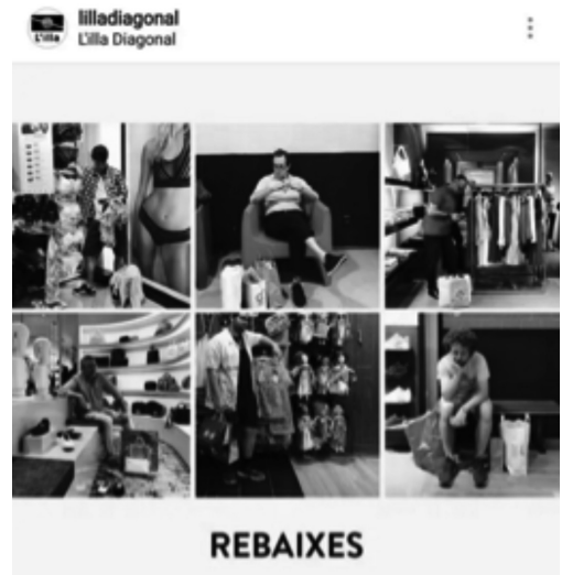
Imagen 23 · Campaña Diagonal (2018)

A esta clasificación debemos añadir el rol de la mujer como elemento molesto en el ciclo vital del hombre. Ha sido una nueva vía de desigualdad que ha cobrado fuerza en los últimos años, con denuncias recogidas (Imagen 23). Una vez más, justificado como un recurso de humor, los estereotipos sobre la mujer son remarcados. La asociación Ecologistas en Acción otorga, desde 2008, los Premios Sombra a los peores anuncios del año «por transmitir valores sexistas, xenófobos,