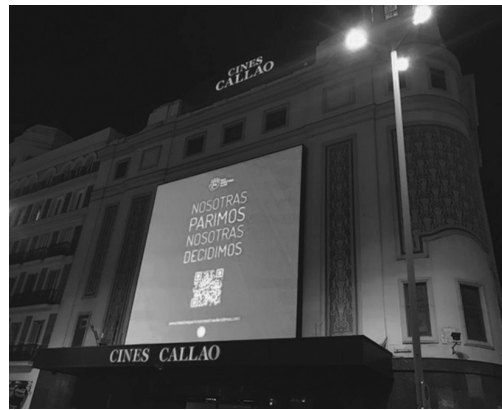
Imagen 4 · Campaña asociación nuestros hijos (2018)

mayoría aplastante de las quejas (92,5 %) proceden de particulares (7,5 % de colectivos).