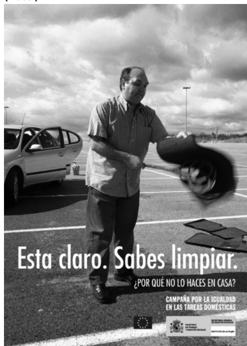
Imagen 6 · Campaña Ministerio Igualdad (2009)

Desde otro punto de vista, todo esto supone la existencia de una conciencia clara en torno a las consecuencias sociales que tiene la publicidad. Tanto es así que ya en 2000 la Asamblea de Naciones Unidas indicaban que «la revolución en la marcha de las comunicaciones mundiales y la introducción de las nuevas tecnologías de la