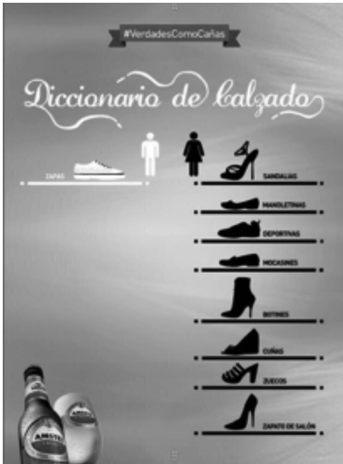
Imagen 18 · Campaña Amstel 2 (2012)