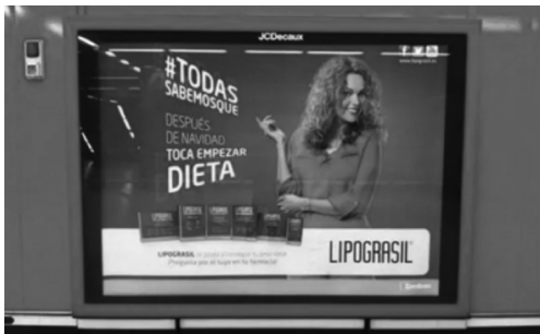
Imagen 10 · Campaña Lipograsil (2014)

gación y se elimine la capacidad de decisión sobre su propio cuerpo. Tal es el caso de la campaña de Lipograsil de 2017 (Imagen 10) donde se da por sentado que después de las navidades «hay que ponerse a dieta». En este caso sí se producen denuncias por estas circunstancias. En 2016 fue la marca cosmética Olay quien recibió recomendaciones del Observatorio al indicar la belleza como «la mejor versión de las mujeres».