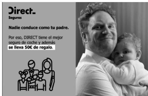
Imagen 25 · Campaña Direct Seguros (2016)

masculino ha cobrado especial fuerza. En este sentido, queda claro que la solución no parece encontrarse en que el mismo uso inadecuado que se realizaba de este recurso se aplique ahora al hombre. Un ejemplo claro es la campaña de Dolce Gabbana, que tras la denuncia recogida en su campaña de 2008 (Imagen 2) respondió con campañas como la publicada en 2016 (Imagen 26). Obviamente este recurso ha suscitado un profundo debate, tanto por el uso visual del cuerpo masculino como por el planteamiento de roles comunes a ambos sexos. La campaña publicada por el Gobierno de La Rioja en 2018 con el gallo del Día de la Mujer fue denunciada ante el ente autonómico responsable por esta circunstancia (Imagen 27).