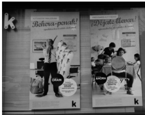
Imagen 8 · Campaña Kutxa Bank (2017)

laboral de las mujeres. De esta forma se considera la existencia de profesiones «femeninas» con un menor nivel de responsabilidad que las profesiones consideradas «masculinas» (O'Driscoll, 2018). De esta forma se habla de médicos y de enfermeras, de abogados y secretarias, etc. Este hecho no cuenta con denuncias al tratarse de un planteamiento más sutil, pero sigue siendo común en la publicidad actual. Debemos destacar la polémica desatada en 2018 con los datos aportados por el Sindicato de Enfermería «Satse» que, tras un estudio sobre la situación de la profesión, puso en marcha una campaña titulada «Rompe con los estereotipos» (Imagen 9). El sindicato denunciaba la difusión de imágenes y mensajes que atentaban contra la dignidad de las enfermeras