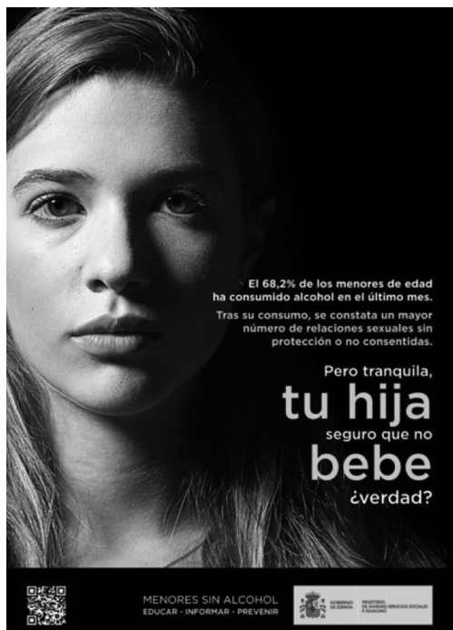
Imagen 5 · Campaña Ministerio (2017)

“la campaña muestra la imagen de una joven y, junto con unos datos sobre consumo de alcohol por menores, se inserta el siguiente texto: «Tras su consumo, se constata un mayor número de relaciones sexuales sin protección o no consentidas». El mensaje responsabiliza a las mujeres de la posible violencia sexual que pudieran sufrir por estar bajo los efectos del alcohol y puede interpretarse como una justificación de las agresiones” (Observatorio, 2017).