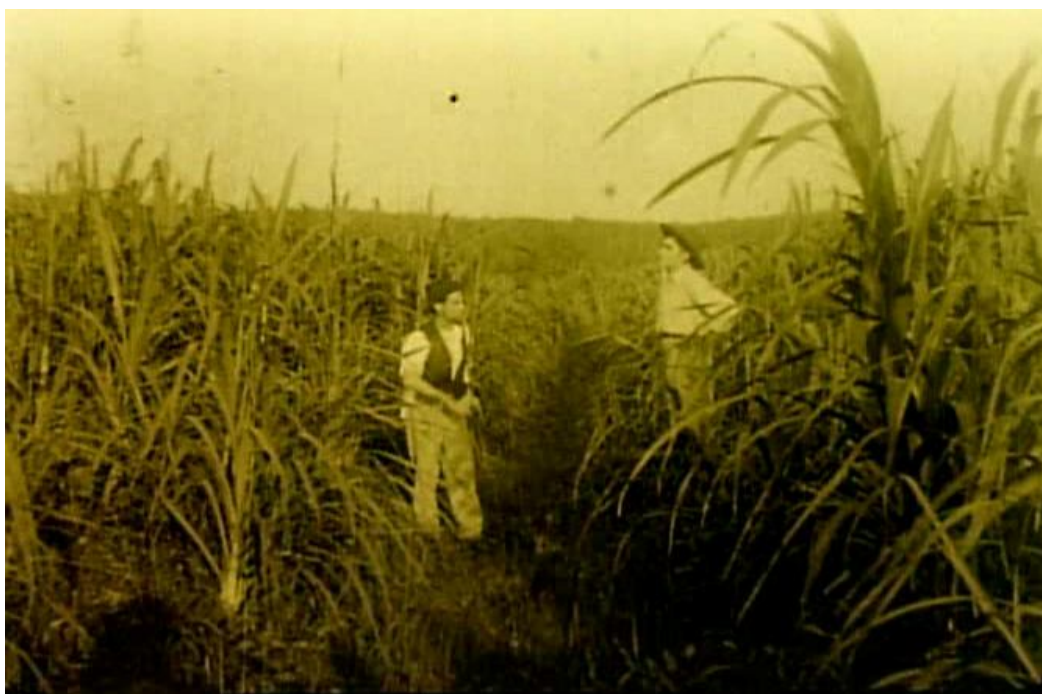
Fotograma tingido de Jurando vingar (Ary Severo, 1925), em que se vê o protagonista (à direita) e seu empregado inspecionando a plantação de cana-de-açúcar.

regionais sem, no entanto, se afastar do modelo do cinema de aventura. É sintomático que a “coisa nossa” levada para o filme sejam as paisagens rurais da Zona da Mata (faixa de terra próxima ao litoral) e as plantações de cana-de-açúcar, principal riqueza econômica do estado. Neste ambiente regional, porém, tanto a caracterização do protagonista quanto suas ações seguem a iconografia e os padrões do western : com chapéu de abas largas, calças de montaria e lustrosas botas de cano alto, ele enfrenta os bandidos que matam sua irmã e sequestram sua noiva. Neste entrelaçamento entre elementos regionais e de gênero, observamos também uma curiosa mistura entre a figura do caubói e a imagem do jovem senhor de terras, bastante característica da região. Embora seja apresentado no intertítulo como “agricultor”, o protagonista se configura bem mais como um bem-sucedido proprietário de plantações de cana-de-açúcar, tanto que, em determinado momento, se desloca até uma usina próxima para negociar a venda de duas mil toneladas de cana produzidas em suas terras. Para além de mostrar as paisagens características, Jurando vingar faz questão de apresentar um campo que é também espaço de produção e de lucro.