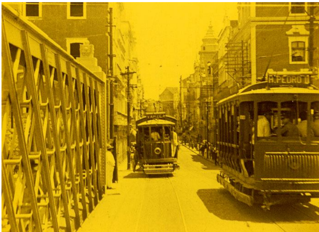
Fotograma tingido de Veneza americana (Pernambuco-Film, 1925), mostrando os bondes no centro do Recife.

Em Veneza americana , não deixa de ser surpreendente perceber como a rigidez do filme institucional e de propaganda governamental vem permeada por procedimentos que remetem ao cinema dos primeiros tempos: o encanto por máquinas, mecanismos e movimentos (incluindo os da própria câmera, muitas vezes acoplada a trilhos, carros, bondes e até a uma ponte giratória); o recorrente uso de cores (tingimento e viragem); a utilização de truques e efeitos visuais de realização simples mas com resultados graciosos; a autoreferência irônica ao trabalho e à percepção do cinegrafista. Curiosamente, ao procurar elaborar uma representação moderna da cidade do Recife, o filme irá recorrer não a um modelo cinematográfico que lhe é contemporâneo e sim às experiências dos primeiros tempos do cinema.