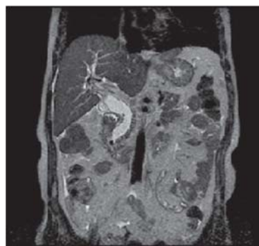
Figura 7. RMN de hígado y vías biliares, no se evidencia recidiva de enfermedad a los 6 meses de control post operatorio.