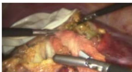
Figura 4. Legrado con las gasas embebidas con hipersodio en toda la pared quística, luego introducidas dentro de la bolsa colectora.

Se realizó liberación de adherencias, colocación de gasas embebidas con hipersodio, aspiración de contenido de quiste, instilación de solución hipertónica a cavidad de quiste, se deja solución por 5 minutos, y posteriormente se procedió a destechamiento de quiste, verificación de hallazgos, aspiración de contenido con remoción completa de vesículas, luego se realizó raspado con gasa con hipersodio en lecho quístico y finalmente colocación de drenes (laminar y tubular), en espacio de Morrison y en lecho de cavidad quística destechada, y colocación de epiplón mayor en dicha cavidad.