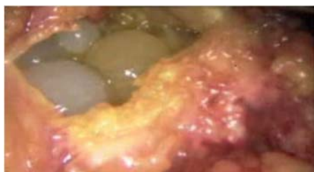
Figura 3. Apertura de pared quística y visualización de vesículas hijas.

Asociado a una prueba de Western Blot positivo para Hidatidosis, se decide realizar cirugía laparoscópica programada, previo tratamiento de un mes con albendazol a 10mg/Kg/día. Se evidencia en el intraoperatorio adherencias laxas y firmes de epiplón a vesícula biliar y estructura quística de 20x15 cm. de diámetro, que comprende los segmentos IVA, IVB y V, de paredes gruesas, conteniendo liquido turbio y biliar, además de vesículas hijas múltiples siendo la mayor de 6cm. aproximadamente; dentro de la cavidad del mismo, se evidencia comunicación con otro quiste más pequeño de 8x6cm., dependiente aparentemente de segmento I, que contiene abundantes vesículas, las cuales son removidas y absorbidas en su totalidad (Figura 3 y 4).