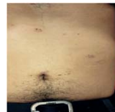
Figura 6. Paciente al alta de consultorio externo de cirugía.