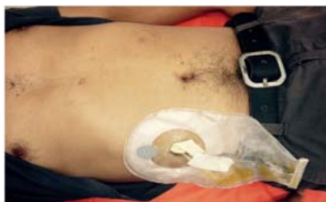
Figura 5. Paciente durante el seguimiento en consultorio externo de la cirugía y fistula biliar instaurada.

Paciente cursa en el postoperatorio inmediato con evolución favorable de los parámetros clínicos, afebril, con secreción sero-biliosa a través de drenaje mixto. Inicia tolerancia a las 24 horas de su postoperatorio y es dado de alta al 4 día, con gasto bajo por drenaje mixto de iguales características que su estancia hospitalaria. En consultorio externo se diagnosticó fistula biliar establecida, cuyo seguimiento se llevó a cabo hasta la resolución del mismo en 5 semanas, desde el postoperatorio, los controles ecográficos y séricos fueron normales (Figura 5 y 6).