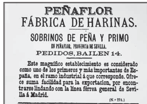
1. ANUNCIO DE LA FÁBRICA DE HARINAS DE PEÑAFLOR. GÓMEZ ZARZUELA, MANUEL. GUÍA DE SEVILLA Y SU PROVINCIA PARA 1883 . SEVILLA: IMPRENTA Y LITOGRAFÍA DE JOSÉ MARÍA ARIZA, 1883, p. 534.

INMACULADA CARRASCO GÓMEZ Universidad Pablo de Olavide