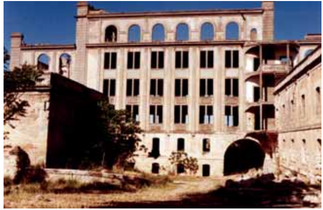
6. FOTOGRAFÍA GENERAL DEL LATERAL DE LA FÁBRICA.