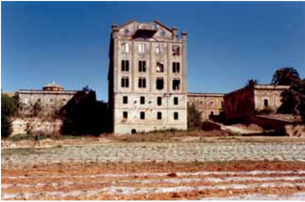
5. FOTOGRAFÍA GENERAL DESDE EL RÍO (AMP, 2000).