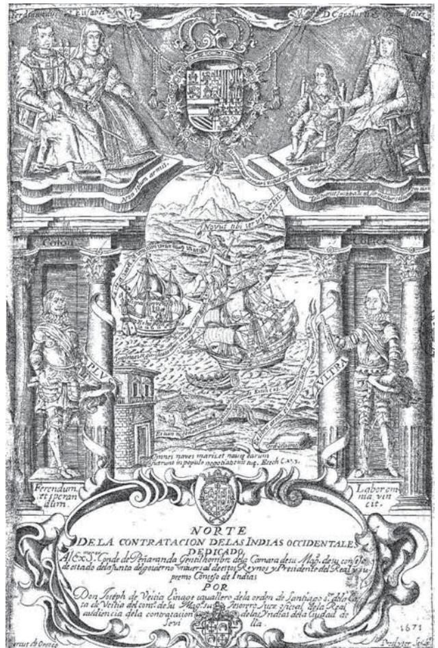
JOSEPH DE VEITIA LINAGE, MARCOS OROZCO, GRAB. NORTE DE LA CONTRATACION DE LAS INDIAS OCCIDENTALES GRABADOR 1672 SEVILLA, IUAN FRANCISCO DE BLAS, IMPRESSOR MAYOR DE LA DICHA CIUDAD, 1672, PORTADA. BNE. R/19602.