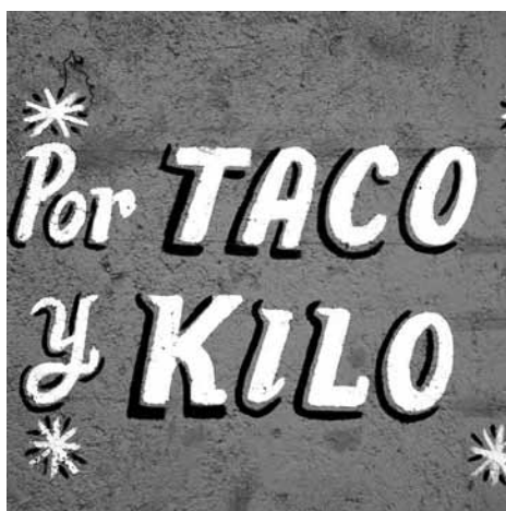
Figura 2. Emulación de sombra en rótulo de puesto callejero (Think Tank, 2016, s/p).

Las letras son elementos constitutivos esenciales en estas grafías, se pueden observar ejemplos que hacen uso de elementos expresivos sorprendentes como son los degradados y añadidos de sombras que emulan la tridimensionalidad y ejercen una fuerza de atracción imposible de evadir como se muestra en la Figura 2. El dibujo de estos rótulos básicamente está realizado con el nombre del establecimiento, también se agregan en la mayoría de los casos el tipo de producto que se vende en él. La forma de representar esta tridimensionalidad es muy variada, puede ser a través de una línea que aparenta la proyección de la sombra de la letra o como el plano dibujado para conferirle dicho atributo.