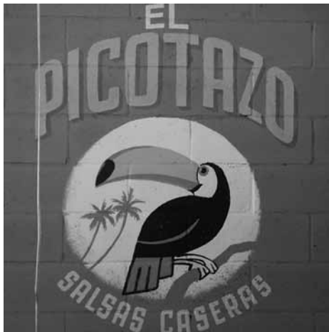
Figura 3. Rótulo de marca para salsas caseras (MXCity, 2016, s/p).

Estos añadidos de volumen se usan de manera indistinta, puede ser en un anuncio de comida en un puesto callejero hasta en identificadores y marcas (Ver Figura 3) o de agrupaciones musicales, que en cualquiera de los casos su propósito final es el de captar la atención y añadirle cierta personalidad. También se observa que la perspectiva acompaña a muchos de estos letreros, la letra en forma de arco o en aumento progresivo de tamaño ya sea de lado a lado o inclusive con convergencia hacia el centro. Los planos inclinados y la aparente aleatoriedad de los mismos le brindan a la composición un dinamismo íntimamente ligado al aparente desorden. Es importante señalar que detrás de todos estos rótulos y letras dibujadas hay rotulistas con una técnica excepcional que seguramente estaban adiestrados en las artes caligráficas, tal como lo comentan Checa-Artasu y Castro (2008).