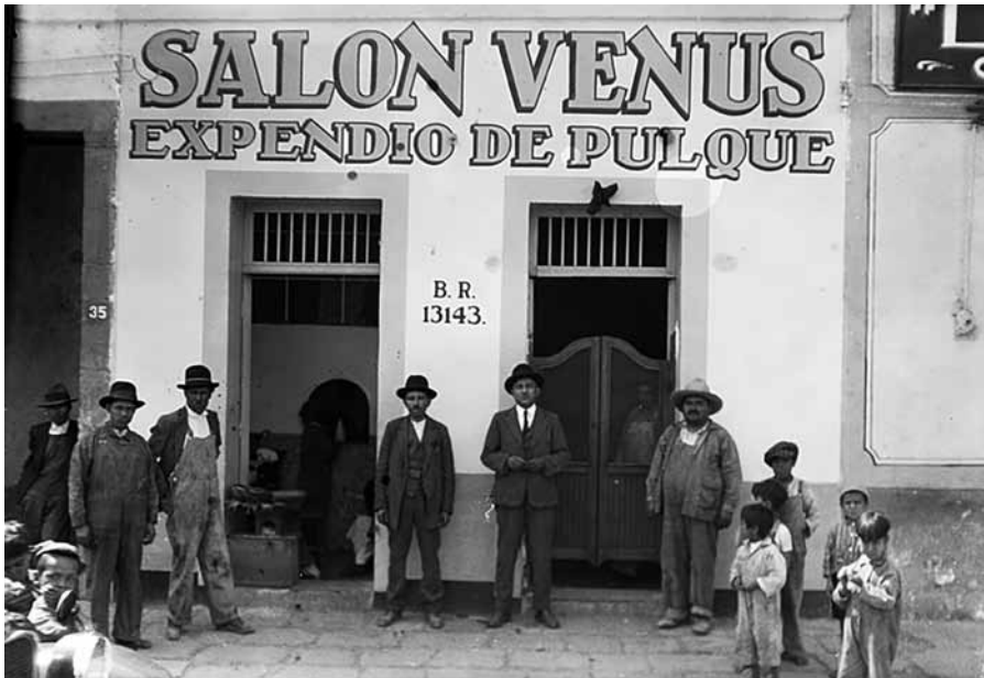
Figura 1. Pulquería Amores de Cupido en la esquina de la avenida Santa María la Redonda, hoy el Eje Central y la Calle del Órgano, en las inmediaciones de la Lagunilla, hacia la década de 1920 (La ciudad de México en el tiempo, 2017, s/p).

por supuesto las publicaciones editoriales de su tiempo debieron aportar cierta influencia que en consecuencia originaron y explotaron la expresión icónica tipográfica de la época. También el registro fotográfico de la primera mitad del siglo XX demuestra que las tiendas de abarrotes, las farmacias, pulquerías y cantinas entre otros establecimientos del México antiguo tenían en sus fachadas rótulos de diversas características los cuales sin duda se hacían por encargo a artistas gráficos. Según Troconi (2018) hay un componente que existe pero es imposible registrar a lo que se denomina como la adaptabilidad. Resulta necesario mencionar que nuestro país venía de una colonización que tuvo influencias europeas mezcladas con las costumbres y usos de esta nación, posteriormente llegó la independencia y después la revolución, el país se encontraba casi en ruinas y con las ideas liberales y sus reminiscencias progresistas obligaron a que los comercios y propietarios se adaptaran a los recursos y necesidades específicos, si bien no se identifica una profesionalización de lo que hoy algunos denominan Diseño gráfico popular, queda claro que había un grupo de dibujantes y rotulistas de oficio (Ver Figura 1), que conocía el contexto y adecuaban la gráfica según las necesidades que se iban presentando. Esta capacidad es un componente que aunado a la creatividad dieron como consecuencia la plasticidad de la gráfica popular mexicana en sus inicios.