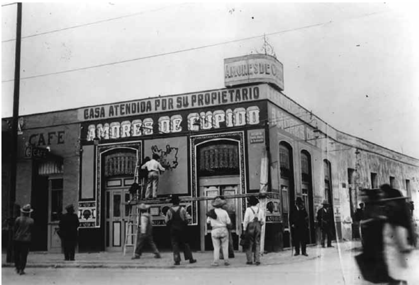
Figura 7. Fachada del expendio de pulque Salón Venus (Relatos e historias en México, 2019, s/p).

Finalmente la dimensión lingüística es la menos estudiada, pero en esta subyacen las raíces más profundas de la identidad mexicana, en ella se representan las costumbres, los regionalismos, la cultura y sus tradiciones que la gráfica popular mexicana hace uso de ellos. Este componente a diferencia de otros países se utiliza con diversos fines y hace uso del lenguaje característico del mexicano, el sentido del humor y el doble sentido son utilizados sin prejuicios. Es un recurso utilizado en muchos comercios para publicitarse o incluso se usa como el mismo nombre del establecimiento, un ejemplo palpable aparece en la Figura 7 “Salón Venus” en una clara e inequívoca referencia a los placeres de la vida. No queda claro si su uso es con una intencionalidad de venta, pregnancia a la mente o simplemente su uso es de carácter inconsciente. Muchos de los ejemplos de este breve análisis evidencian la importancia del uso del lenguaje y su representación en el grafismo, nos sitúan ante el reto de retomarlo como objeto de estudio con más profundidad, sin embargo se considera que este acercamiento proporciona elementos suficientes para destacar su importancia en la identidad de la gráfica popular mexicana.