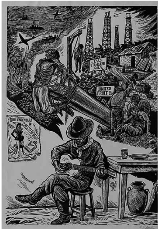
Figura 5. Compañeros extranjeros. Grabado en linóleo (Gato Pardo, 2017, s/p).

Sin embargo en aquellas utilizadas con fines comerciales algunas tienen distintos rasgos, se identifica en diversos casos el uso de metáforas visuales, combinaciones de objetos y animales caricaturizados y llevados al nivel incluso de lo cómico. Su representación en técnicas es disímil la única constante es que se les confiere una importancia preponderante tanto en tamaño como en composición. En general se podría concluir que la imagen es primordial en la gráfica popular, es un recurso que proporciona la vitalidad y atracción suficiente para poder llegar a su propósito. Es la imagen el elemento que aporta la referencia emotiva y simbólica más importante, en ella descansa ese imaginario visual y refuerza en gran medida la huella mnemotécnica necesaria para generar la identidad a la que se ha hecho referencia.