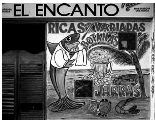
Figura 6. Rótulo de fachada para la cantina El Encanto (Zonezero, 2018, s/p).

Hay casos como en las carteleras de espectáculos de lucha libre en las cuales se utilizan barridos de dos o tres tintas que proporcionan resultados altamente contrastantes y con fusiones poco imaginables, en ellas se optimiza el recurso y se solucionan los posibles problemas técnicos de registro. En otros ejemplos en los que se requiere rotular la fachada de algún local o establecimiento, ésta se utiliza como un gran lienzo y se aplica color de fondo de una manera totalmente deliberada para captar la atención, de esta forma, se encuentra con grandes dimensiones de colores estridentes y con combinaciones de fondo figura inigualables, pareciera que no hay un juicio o criterio para su uso, son tan alucinantes las mezclas que en algunas se pueden encontrar grandes gamas y tonos en el mismo anuncio. Todo esto le confiere una identidad a la gráfica mexicana incomparable, sólo se pueden observar algunos casos en países caribeños y en algunas latitudes del continente africano. Estos ejemplos se encuentran ya sea en empaques de cigarrillos, volantes, bardas anunciando algún grupo musical, puestos callejeros e incluso revistas de espectáculos como se observa en la Figura 6. La dimensión cromática caracteriza a la gráfica popular mexicana, más aún, la define y alimenta es una dimensión que pareciera ser un grito de libertad ante tanta opresión histórica social, el desenfado de su uso solo puede tener un significado: El grito del aquí estamos, esto somos.