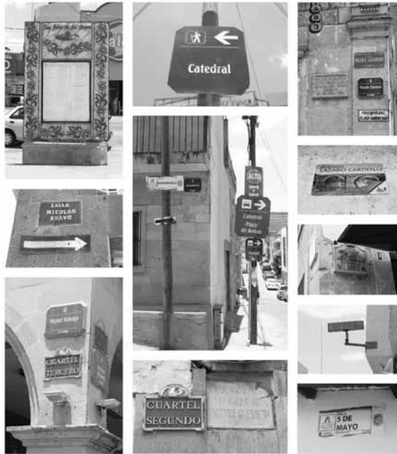
Figura 2. Placas de nomenclatura, informativas y de tráfico (Cisneros, 2019).