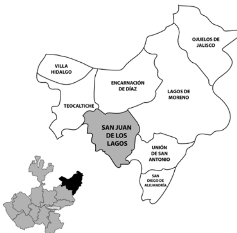
Fig. 1: Mapa San Juan de los Lagos (IIEG, 2012, s/p.).

San Juan de los Lagos se ubica en la región Altos norte del estado de Jalisco como se aprecia en la figura 1, con una población de 43,000 habitantes, esta región fue habitada por los Nahuas antes de la conquista.