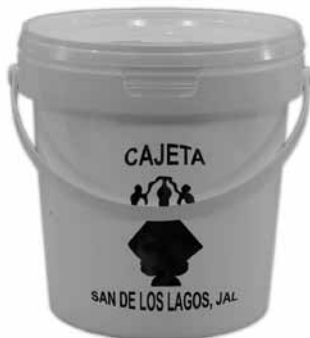
Figura 3. Envase para cajeta de leche (Cisneros, 2019).

Uno de los artículos representativos es el dulce de leche llamado cajeta, este se ha vuelto popular y distintivo por los visitantes, este tiene cuatro variantes natural, envinada, con tequila, nuez y vainilla, este producto se ofrece por los pasillos cercanos a la basílica. Al ser del agrado de los visitantes, es común apreciar cómo adquieren cantidades considerables en botes genéricos, de distintas capacidades, el material es Polietileno de alta densidad –PEAO–, 65050 y Polietileno de baja densidad –PEBO–, 17070, hecho por proceso de inyección este contenedor de forma cilíndrica con anomalía, con cambio de diámetro en la parte superior, teniendo un ensanchamiento y reborde para engarce de tapa, en la parte superior se ubica el asa. En cuanto a la imagen gráfica como es habitual, tiene la síntesis de la Virgen de San Juan de los Lagos estampada de manera directa sobre el contenedor o impresa en vinil auto adherible, a manera de calcomanía o pegatina, y la palabra que describe el contenido que guardará el envase, con el propósito de diferenciar el producto respecto al otros similares, pero de diferente origen, casa, o razón social. Es decir una vestimenta limitada y genérica, ya que es similar en la mayoría de los negocios.