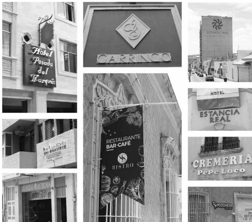
Figura 7. Rótulos y anuncios en las calles en la periferia de la Basílica (Cisneros, 2019).