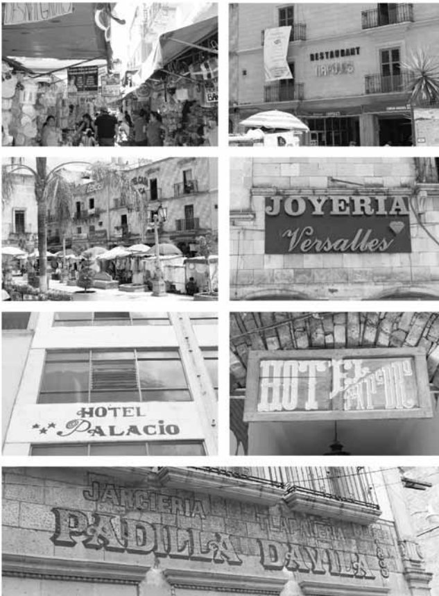
Figura 6. Rótulos y anuncios en las calles aledañas a la Basílica (Cisneros, 2019).

Se puede apreciar que los rótulos, de los comercios más cercanos o en las inmediaciones a la catedral, sea cual sea el tipo de negocio, conserva rasgos característicos de una tipografía estudiada, o al menos reflexionada, donde prevalece el tipo de fuente con serif generalmente, rotuladas a la vieja escuela, ya sea directa sobre el muro, o en algún tipo de soporte. Mientras que los comercios más alejados, utilizan fuentes más variadas y modernas, donde destacan las fuentes de palo seco, las aplicaciones en acrílicos u otro tipo de materiales y soportes, rotuladas por medios digitales.