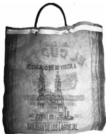
Figura 4. Bolsa para mandado en malla textil plástica, con impresión en serigrafía (Cisneros, 2019).

Las características de la bolsa en lo general se podría decir que son de dimensiones que fluctúan entre los 45 cm x 45 cm, a 15 cm x 10 cm, y de materiales como lo es la malla textil de hilo plástico, pudiendo ser polipropileno, o en monofilamento de polietileno de alta densidad. La forma es rectangular y dispuesta en el eje vertical de su lado más corto en posición superior e inferior con apertura en la parte superior y cerrado por sus tres lados restante, consta de dos asas de plástico tubular, adosada a la malla mediante remaches y generalmente reforzada en el perímetro de la boca con una tira de plástico laminado a manera de bias.