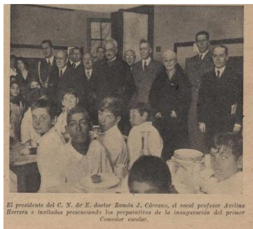
Imagen 2: Inauguración de los primeros comedores escolares en Mataderos y Villa Lugano (Capital Federal). 2 de julio de 1932.