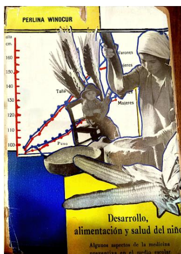
Imagen 4. Portada del libro Desarrollo, alimentación y salud del niño (Winocur, 1943)

Como ya hemos destacado, el recorrido histórico realizado da cuenta de la importancia que tuvo la niñez para los gobiernos conservadores y liberales que se alternaron en el poder en las primeras décadas del siglo XX. Y no era para menos: el proyecto de Nación impulsado a fines del siglo XIX contemplaba la necesidad, ya fuera por utilidad o por sensibilidad, de concursar los recursos materiales y espirituales para intervenir sobre la infancia desamparada. Esta impronta quedaría simbolizada, trazando cierta continuidad con las políticas reseñadas en este trabajo, durante el gobierno peronista (1946-1955) en el lema oficial que rezaba categóricamente “Los únicos privilegiados son los niños”.