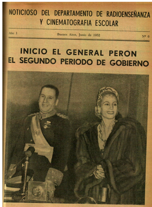
Portada del Noticioso del Departamento de Radioenseñanza y Cinematografía Escolar n° 6, junio 1952.

Al respecto es posible esbozar tres cuestiones centrales, relacionadas entre sí, que crean tensiones entre una parte importante de la plana docente y las políticas emanadas por el peronismo. La primera pasa por el culto al personalismo, que chocaba con las premisas tradicionales de la docencia como una carrera de origen y tendencias liberales, tal como se lee en un poema publicado en la editorial correspondiente a los números de mayo y junio de 1953, un año después de la desaparición física de Eva Perón: