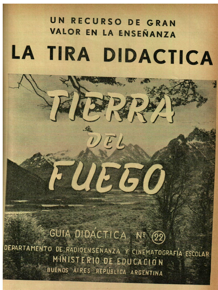
Sección Tira Didáctica "Tierra del fuego", Noticioso del Departamento de Radioenseñanza y Cinematografía Escolar n° 7, julio 1952, p. 17.

ellas contaba con un texto explicativo detallado con el objetivo de servir al docente como guía para poder llevar adelante la clase.