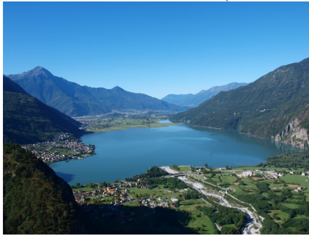
FIGURA 1. PANORÁMICA LAGO DE NOVATE MEZZOLA

No obstante el valor natural e histórico y la fragilidad de la zona, en los años 60 se concedió el permiso de colocar una actividad de producción de acero ocupando un área industrial de 70 mil hectáreas, deformando un paisaje único según un típico proceso de estandarización bien descrito por Turri (1967). La fábrica desde 1965 hasta 1991 trabajó 13.500 toneladas de liga fierro-cromo super refinado, utilizando como materias primas minerales de cuarzo, cromo, calcar, carbón (De Vecchi, Bosisio, 1978; Ferrari 1982). Es un proceso metalúrgico que además de contaminar aire y agua, produce escorias. Parte de las