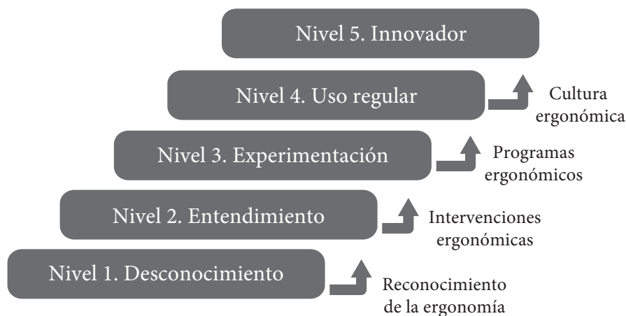
Figura 1. Procedimiento para la aplicación del Modelo de madurez de Ergonomía