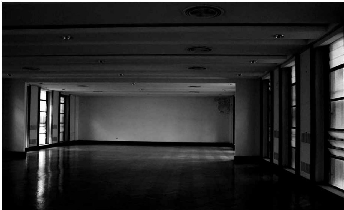
En 2004, la ex Escuela de Mecánica de la Armada se convirtió en el Espacio Memoria y Derechos Humanos, que busca ayudar a comprender la planificación y ejecución del terrorismo de Estado en Argentina y sus consecuencias en el presente. Buenos Aires, octubre de 2011.

Me condujeron a una sala, al entrar sentí mucho olor a sangre [...], escuchaba individuos que hablaban bajo, uno de ellos me desató las manos y me ordenó que me desnudara, les dije que por favor no lo hicieran, pero luego en forma violenta me desvistieron, dejándome sólo la capucha puesta, me pusieron en una especie de camilla amarrada de manos y pies con las piernas abiertas, sentí una luz muy potente que casi me quemaba la piel. Escuché que estos individuos se reían, luego un hombre comenzó a darme pequeños golpes con su pene sobre mi cuerpo, me preguntó de qué porte me gustaba, otro hombre escribía cosas sobre mi cuerpo con un lápiz de pasta. Luego vino el interrogatorio [...], en