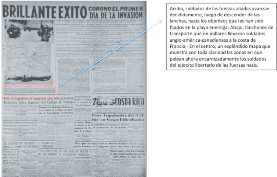
Figura 8 DESEMBARCO EN NORMANDÍA