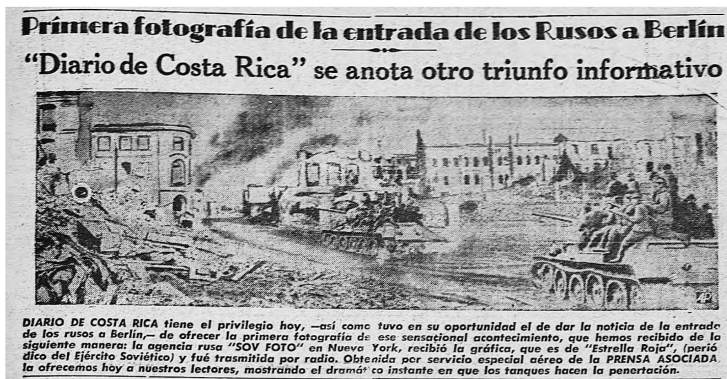
Figura 13 RUSOS ENTRAN A BERLÍN