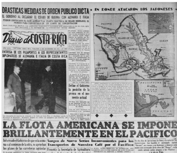
Figura 6 MOVIMIENTOS BÉLICOS