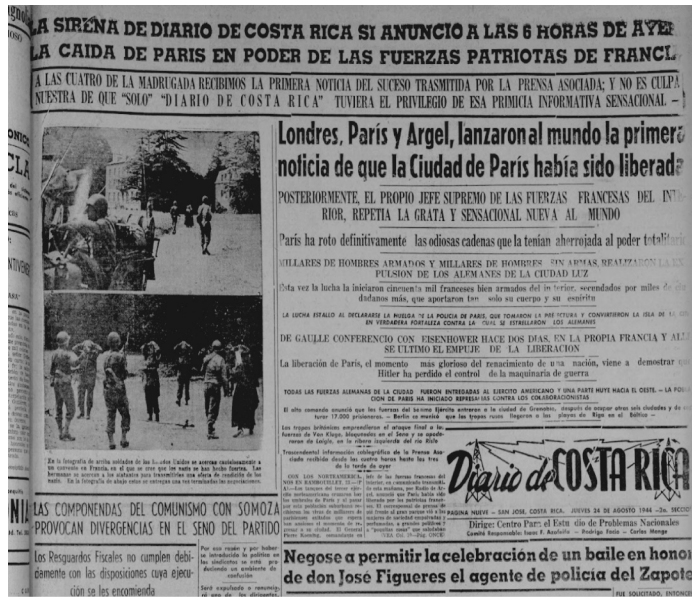
Figura 10 COMPETENCIA POR INFORMAR