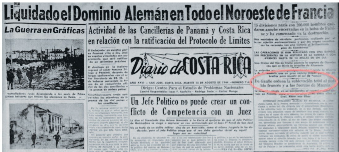
Figura 9 LIQUIDADO EL DOMINIO ALEMÁN