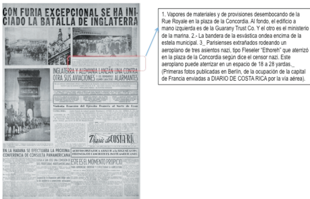
Figura 3 PRESENCIA ALEMANA EN LA CAPITAL FRANCESA