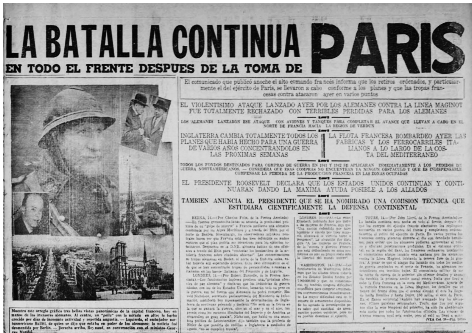
Figura 2 LA BATALLA CONTINÚA AUNQUE PARÍS FUE TOMADA