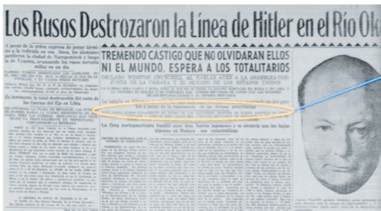
Figura 7 RUSOS DESTROZAN LA LÍNEA DE HITLER

Hong Kong quedó finalmente en poder de los japoneses después de haber agotado su resistencia la guarnición