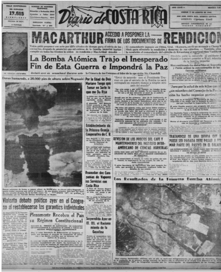
Figura 15 DESTRUCCIÓN CAUSADA POR LA BOMBA ATÓMICA