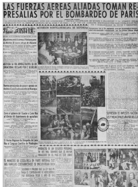
Figura 1 LOS BOMBARDEOS AÉREOS A PARÍS POR EL EJÉRCITO ALEMÁN