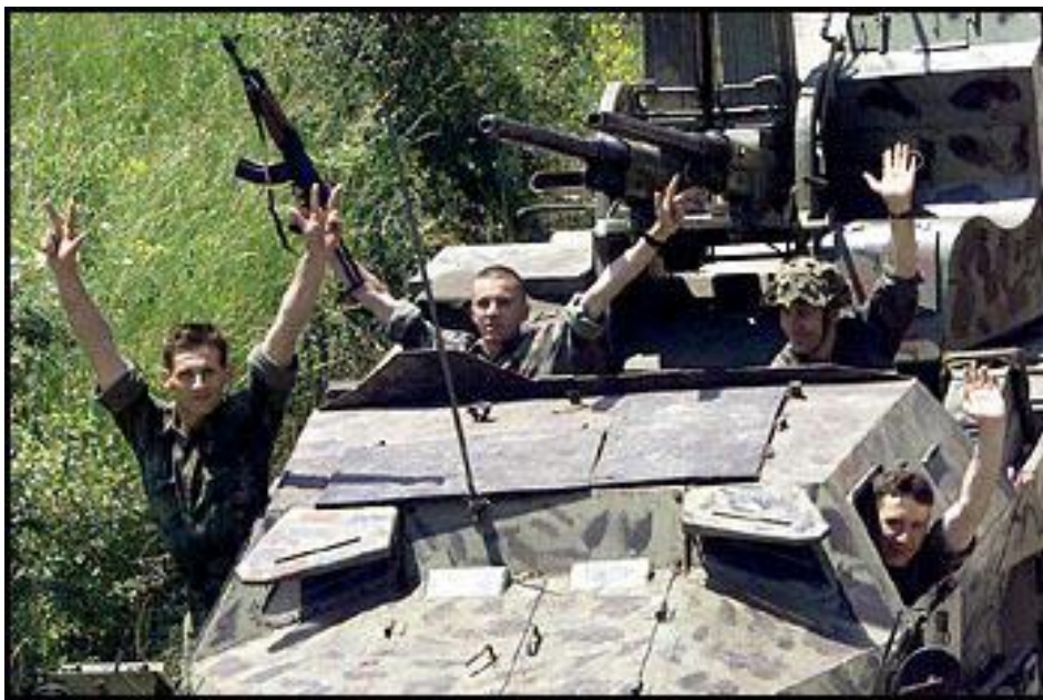
Soldados serbios en la frontera de Kosovo. Junio 99.

Como consecuencia de la falta de acuerdo entre las partes, el plan de Ahtisaari no fue llevado a la práctica, y finalmente no fue adoptado el pretendido estatuto que por parte de la ONU se proponía para Kosovo. Por entonces, la Comunidad internacional esperaba una reacción “albano-kosovar”, que en su caso, podría desestabilizar de nuevo la región, conduciendo posiblemente a unos incidentes parecidos a los de 2004...Por ello, el 19 de noviembre de 2007, la Unión Europea advirtió a Thaçi y sus aliados albaneses que no llevaran a cabo ninguna “declaración de independencia” sin antes realizar una consulta previa 17 .