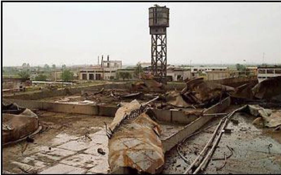
Depósito de combustible de la Compañía “ Jugopetrol ” tras los ataques OTAN.