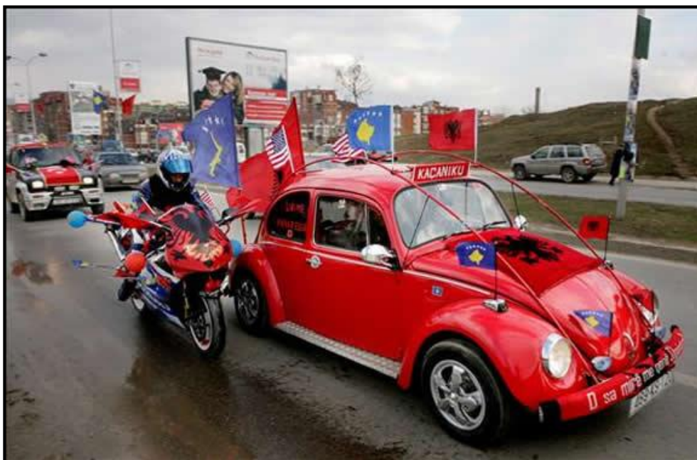
“Celebrando la independencia de Kosovo”.

El razonamiento expuesto por la Corte en el sentido de que la Declaración unilateral de Independencia no vulnera el derecho internacional es cuando menos laxo, y nos hace recordar en otro sentido a los que quizás estuvimos en la zona durante este período, que realmente los bombardeos sobre las unidades militares serbias se hicieron sin un mandato expreso, y claro, del Consejo de Seguridad, y también sin ninguna referencia al derecho internacional...; por ello considero es llamativo que en esta ocasión se haga esta reseña por parte de la CIJ 23 .