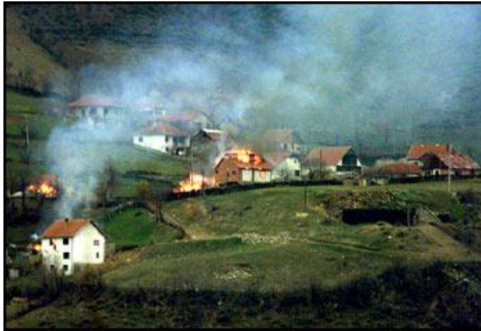
Norte de Macedonia. 2004.