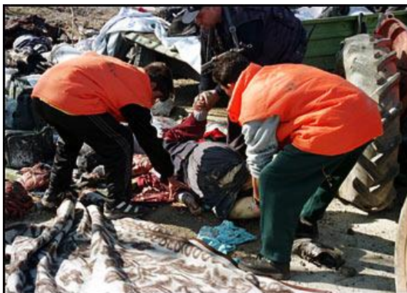
Fotografía de refugiados kosovares siendo atendidos tras ser “víctimas” ataques OTAN (Abril 99).