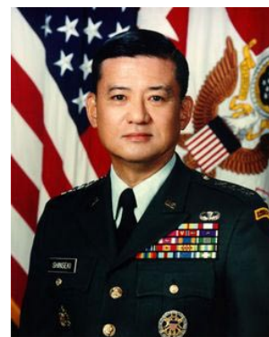
General Eric Shinseki

Frente a esos argumentos, surge de inmediato el recuerdo de la figura del General Eric Shinseki, Jefe de Estado Mayor del Ejército de Tierra de los EEUU de 1999 a 2003. Durante los preparativos para la invasión, Shinseki afirmó el 25 de febrero de 2003 ante el Comité de las FFAA del Senado que la campaña iraquí y la posterior ocupación del país requeriría “varios cientos de miles de efectivos”, basándose en la experiencia de los Balcanes en los años 90. Estas afirmaciones fueron inmediatamente desacreditadas por Rumsfeld y su segundo, el Subsecretario Wolfowitz.