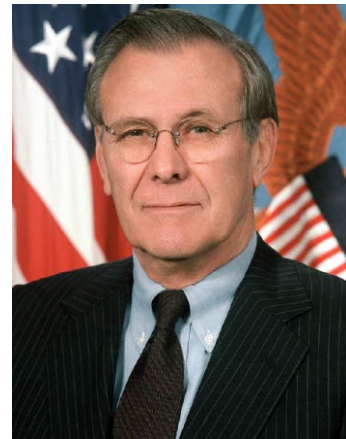
Donald H. Rumsfeld

El 8 de noviembre de 2006 el Secretario de Defensa de los Estados Unidos (EEUU), Donald H. Rumsfeld, presentaba su dimisión al Presidente George W. Bush, tan sólo un día después de la derrota del Partido Republicano en las elecciones legislativas 1 . Tras más de cuatro años de silencio, el pasado 8 de febrero de 2011 Rumsfeld ha publicado su autobiografía, bajo el título “ Conocido y desconocido ”, en cuyas 800 páginas proporciona una visión personal sobre su ya histórico papel en la administración estadounidense, en la que desempeñó múltiples responsabilidades desde principios de los años 70 del pasado siglo 2 .