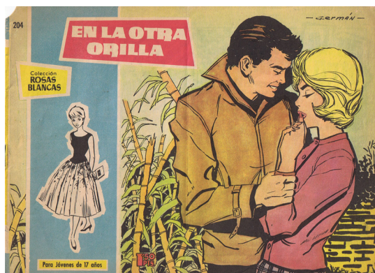
Ilustración 3. Portada de Rosas Blancas

El amor se convirtió en un elemento común de los tebeos femeninos, mostrándose en sus páginas cuáles eran las conductas adecuadas para tener éxito en una relación, siempre desde un punto de vista idealizado y, por supuesto, totalmente asexuado que presentaba el amor como un sentimiento que nada tenía que ver con la pasión física. Portada de Rosas Blancas n.º 198 (1958), editorial Toray.