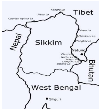
Figura 3. Conflicto de Sikkim.

avanzados indios. La Revolución Cultural 13 tensionó más la situación pues en el verano de 1967 el Ejército Popular de Liberación (EPL) empezó a cavar trincheras. En respuesta, las tropas indias decidieron demarcar el límite fronterizo a lo largo de las