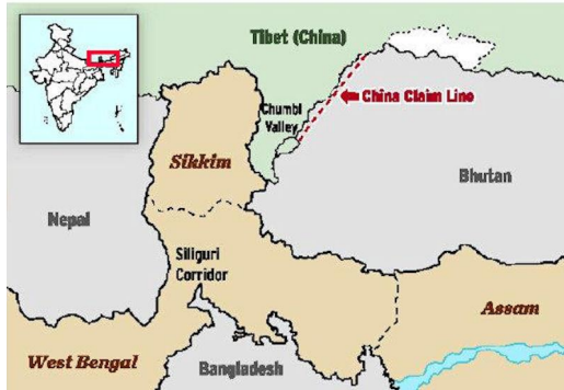
Figura 2. Marco geopolítico regional.

El valle de Chumbi, perteneciente al reino de Sikkim 23 hasta 1791, pasó a manos