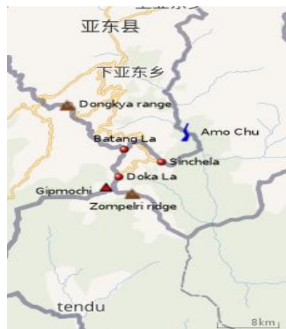
Figura 5. Carretera china de Doklam.

Nueve días después el gobierno de Bután protestó ante China por querer extender en un área disputada la carretera hasta el campamento del ERB de Zornpelri. Para Bután dicha construcción violaba el acuerdo chino-butanés de 1998, pues modificaba el statu quo de la frontera, e implícitamente afectaba a la seguridad india. India expuso que se violaba el acuerdo de puntos fronterizos en la triple unión, pues el Acuerdo de «Entendimiento Común» de 2012 24 entre los representantes especiales Menon (India) y Dai (China), estipulaba que los límites entre India, China y terceros países se ultimarían consultando a los países afectados. China, en respuesta, se quejó de que India omitiera el Tratado anglo-chino de Calcuta (1890) sobre la frontera definida entre Sikkim y Tíbet en la