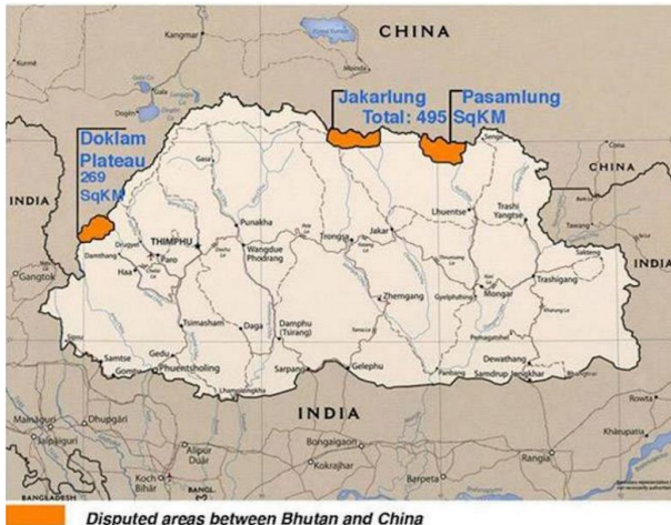
Figura 4. Áreas disputadas de Bután.

Cuando China asumió el control del Tíbet en 1959, Thimphu fortaleció sus lazos con Delhi ante el temor a una invasión y a las reclamaciones territoriales chinas. India incrementó sus guarniciones defensivas en la frontera norte de Bután con Tíbet, mientras