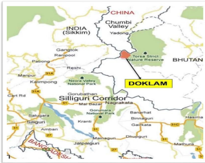
Figura 1. Valle de Chumbi.

Enclavada entre Bután, China e India, se ubica en el vértice sur del valle de Chumbi donde se juntan las crestas montañosas de Dongkya y Zompelri. Este valle, situado entre Yadong (Tíbet) al norte, el valle de Haa (Bután) al este y Sikkim al oeste, es la «daga» de tierra que separa Sikkim de Bután.