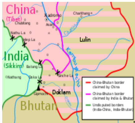
Figura 7. Versiones de la Triple Unión.

Al no existir mapas adjuntos al Tratado anglo-chino la discrepancia subyace en si dicho Tratado estableció «una base para la alineación» o una frontera definitiva. Por su parte, China reveló que en las discusiones de los Representantes Especiales de mayo de 2006