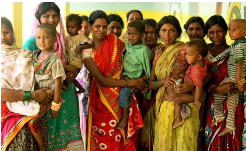
Mujeres y niños de la comunidad pardhi, en Maharashtra, India. Fuente: UNICEF/Sri Kolari. https://news.un.org/es/story/2019/06/1457891

BOLAÑOS MARTÍNEZ, Jorge. Examen periódico universal de los derechos humanos en la ONU: algunos éxitos y controversias. Documento Informativo IEEE 06/2014.