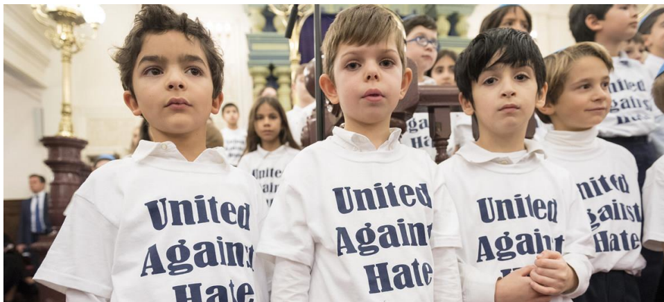
Con el lema «Unidos contra el odio» durante una reunión interreligiosa en la Sinagoga Park East de Nueva York.