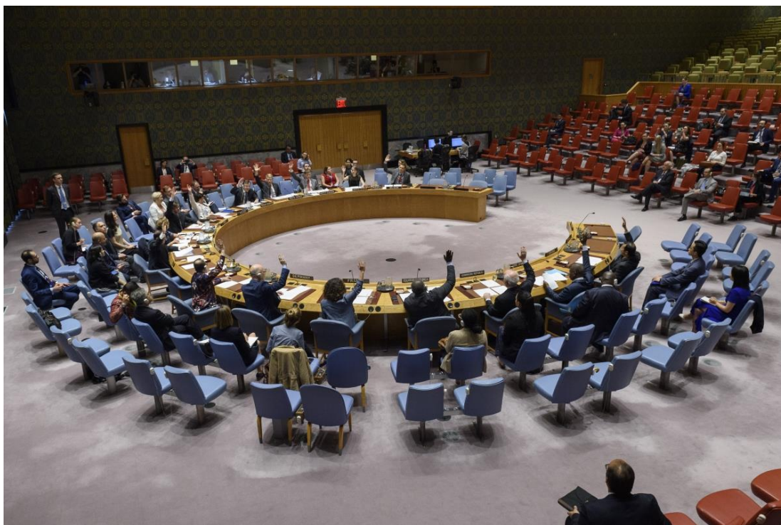
Reunión del Consejo de Seguridad de la ONU el pasado 20 de junio de 2019.