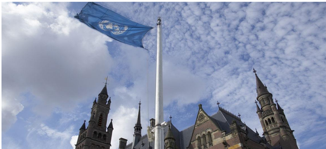
Vista de la sede de la Corte Internacional de Justicia en La Haya.