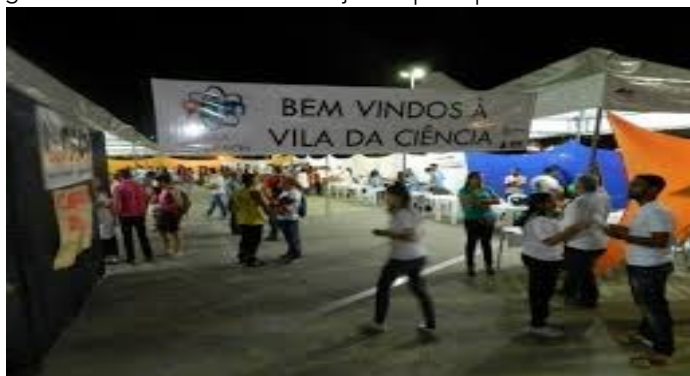
Fotografía 4: Exhibición de los trabajos en plaza pública