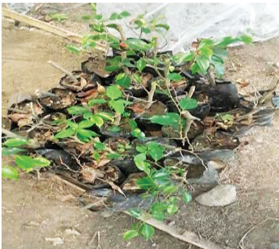
Figura 1 Emisión de brotes.

(*) Las medias con la misma letra no presentan diferencias significativas.