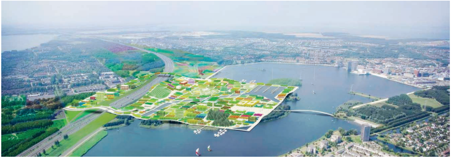
[Fig.1]. Project by MVRDV for Almere Floriade 2022, the world's largest horticultural expo. Source: MVRDV. Proyecto de MVRDV para Almere Floriade 2022, la mayor exposición hortícola del mundo. Fuente: MVRDV.

“You tend to get architecture that pushes the boundaries from these events”