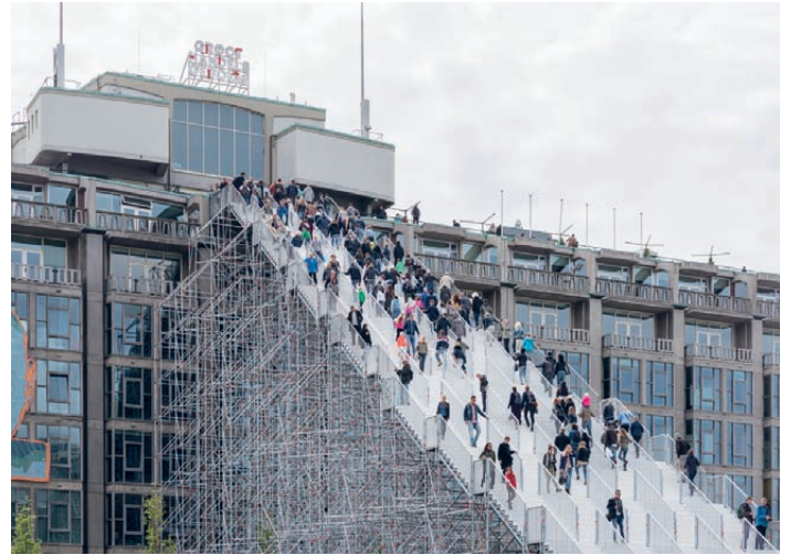
[Fig.3]. 'The Stairs to Kriterion'. Rotterdam, the Netherlands, 2016. 'Escaleras al Kriterion'. Rotterdam, Holanda, 2016.

WM: Ése es uno de los problemas que a veces tengo con estos eventos. Siempre animo a las ciudades a que analicen lo que las hace únicas, y los dos casos que mencionáis son ejemplos representativos de ello. Zaragoza tenía un hermoso río que debía utilizar mejor. En Venlo, el legado tras la expo fue