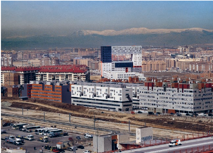
[Fig.4]. 'Mirador'. Sanchinarro, Spain, 2005. 'Mirador'. Sanchinarro, España, 2005.

“I somehow think that optimism helps in getting more funds to do our work and improve various situations. To become cynical and sarcastic slows down change and it has such stupid offenders”