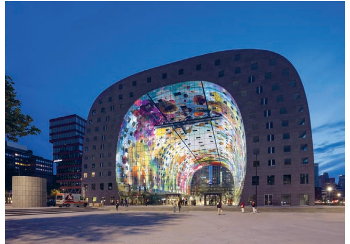
[Fig.5]. Markthal. Rotterdam, the Netherlands, 2014. Mercado. Rotterdam, Holanda, 2014.

WM: The Stairs to Kriterion is a good example. With that project we re-activated the rooftop of one of Rotterdam's most important post-war buildings. With this temporary staircase, people were reminded of the value of these rooftop spaces and their potential to densify the city. Since then, the City has become much more active in envisioning uses