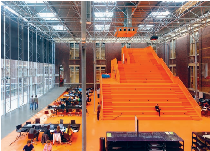
[Fig.6]. 'The Why Factory Tribune'. Delft University of Technology, the Netherlands, 2009. 'The Why Factory Tribune'. TU Delft, Holanda, 2009.

“Supongo que la solución a vuestro dilema es adaptar la comunicación a las necesidades de la audiencia, apoyando vuestro mensaje científico en lugar de comprometerlo”