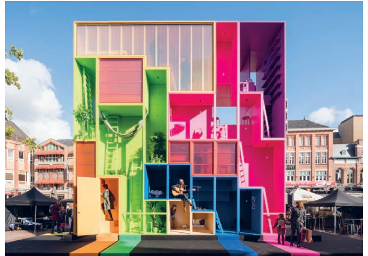
[Fig.7]. '(W)ego', ephemeral installation. Eindhoven, the Netherlands, 2017. MVRDV and The Why Factory (Delft University of Technology). '(W)ego', instalación efímera. Eindhoven, Holanda, 2017. MVRDV y The Why Factory (TU Delft).