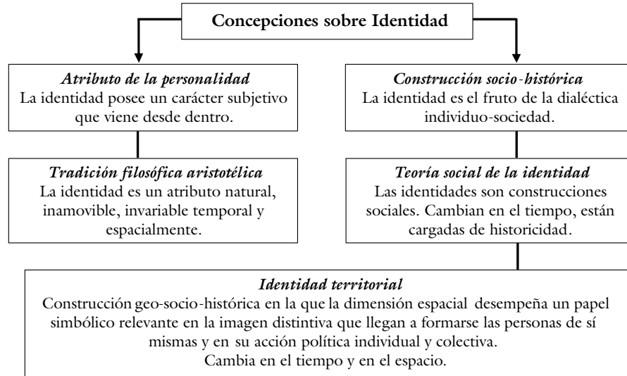
Figura 1. Concepciones de identidad e identidad territorial