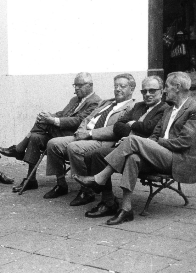
Tertulia en la plaza de España (ca. 1980). CLMR

Es el prototipo de la humildad, buen ciudadano, excelente padre de familia, sincero amigo en toda la extensión de la palabra. Se esfuerza por atender a quienes necesitan de su noble conducta ciudadana, y siempre tiene para los detractores y críticos de pacotilla frases exentas de agresividad.