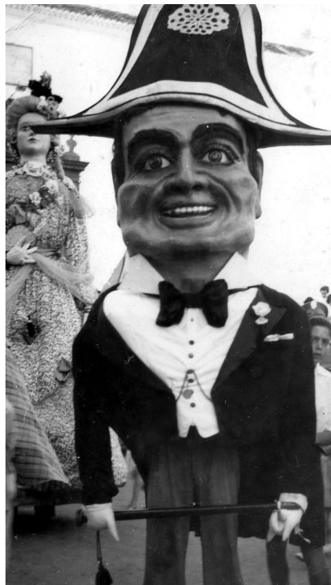
Segunda figura de Biscuy, elaborada en 1935 (1940).

Merece un apartado especial dar a conocer que por iniciativa del presidente de la Comisión de Fiestas de la Bajada