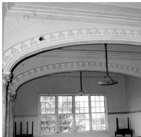
Motivos decorativos del hotel Florida. CLMR

Asimismo, una copia de la Virgen del Buen Viaje que actualmente venera el Santuario de Nuestra Señora de las Nieves.