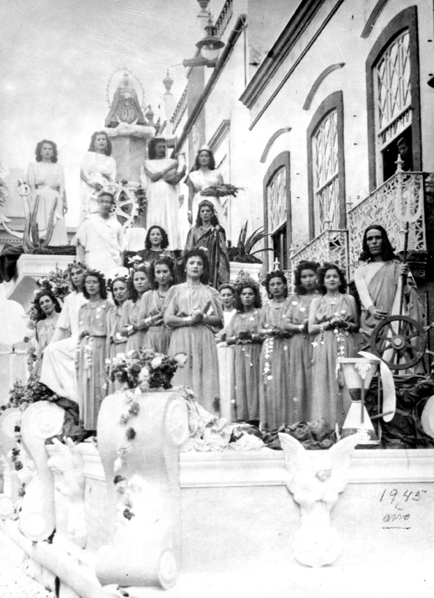
Carroza del Carro Alegórico y Triunfal (1945).