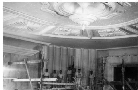
Decoración del cine Parque de Recreo.