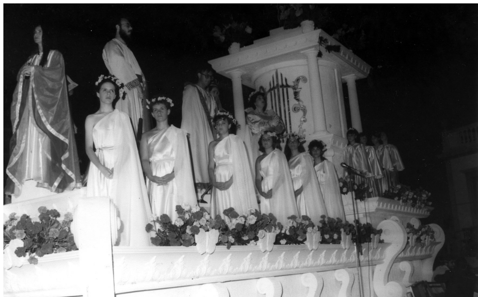
Carroza para el Carro Alegórico y Triunfal (1985). CLMR

Conjuntamente a la ejecución de Carros y de manera simultánea, participó en la elaboración de proyectos, dibujos y decoración de los originales templete para celebrar las tradicionales Loas en la plaza de España. Escenarios para los distintos actos en la plaza de Santo Domingo. Es obra también de sus manos la primera carroza representativa de influencia francesa, entre muchas otras, para la celebración del tradicional Minué. También colaboró en los ya olvidados arcos, que eran pequeños tributos de los restantes ayuntamientos de la isla, para engalanar las principales calles de Santa Cruz de La Palma: el tradicional arco de la Sociedad la Investigadora (Casino), Cabildo Insular y el de Garafía, como los más destacados. También es obra de sus manos la primera