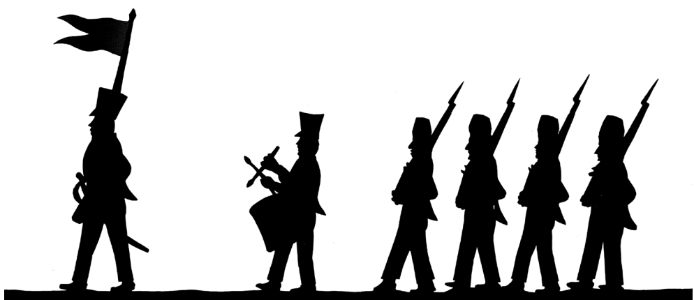
Tiras para proyectar en espectáculos de sombras chinescas (ca. 1810). FF

Entre las imágenes que formaban estas sombras chinescas de La Palma, se encuentran representaciones de la nave y el castillo, miembros del clero, músicos, autoridades, milicias y romeros, todos ellos en el contexto de la escenificación del Diálogo entre el Castillo y la Nave. El estilo y las indumentarias de dichas siluetas son las que delatan la época en que fueron concebidas, periodo situado en torno a 1800. Por tanto, estas sombras chinescas