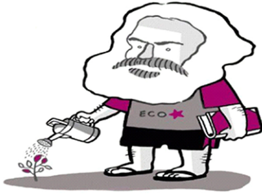
Ilustración 4 representación de Marx Ecosocialista