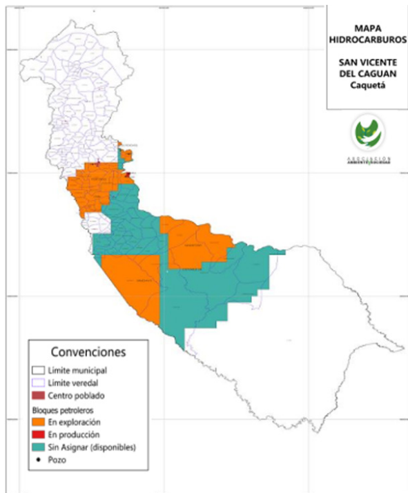
Mapa 1. Bloques petroleros en San Vicente del Caguán