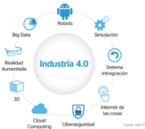
Figura 1. La industria 4.0.