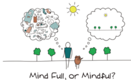
Figura 4. Mindfulness. Fuente: (Rabat-Zinn, 1994).

Jon Rabat-Zinn, profesor emérito de la facultad médica de la Universidad de Massachusetts, define en 1994 el Mindfulness como “prestar atención de una manera especial y deliberada al momento presente y sin emitir juicios de valor” (Rabat-Zinn, 1994). Un ejemplo de ejercicio para practicar la conciencia plena es sentarse relajadamente y centrarse en la respiración durante dos minutos. También se ha demostrado que este tipo de ejercicios mejoran el funcionamiento cognitivo y la capacidad de decisión (Figura 4).