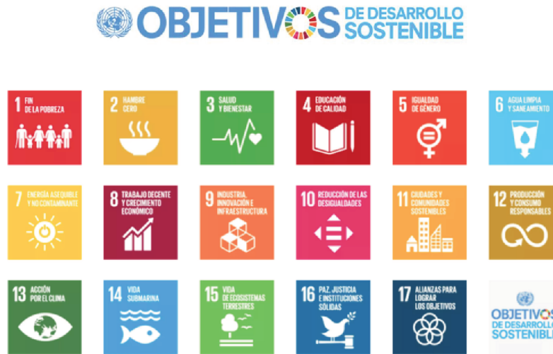
Figura 3. Objetivos de desarrollo sostenible.

Para alcanzar estas metas, todo el mundo tiene que hacer su parte: los gobiernos, el sector privado y la sociedad civil (Figura 3).