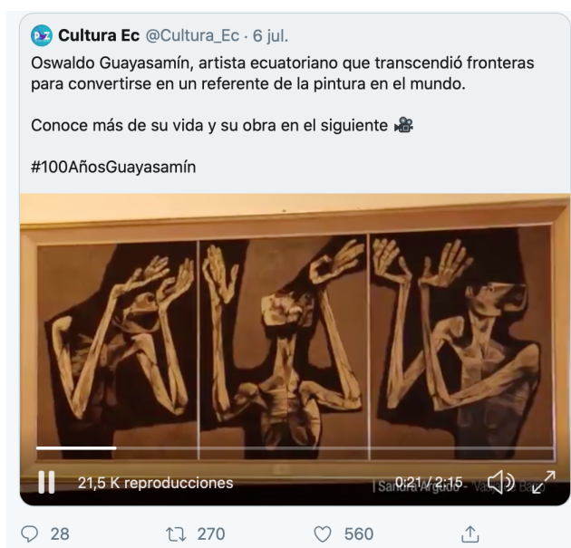
Imagen 1. Tuit #100AñosGuayasamin