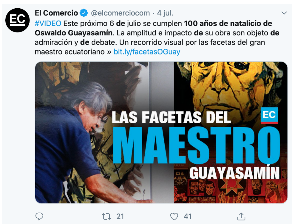
Twitter Diario El Comercio

No existe mayor reflexión del trabajo del artista en ninguna de las dos piezas noticiosas; las historias contadas son reproducciones de otros sitios web, como el de la Capilla del Hombre, medios y plataformas que contienen declaraciones registradas décadas atrás.