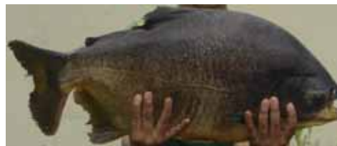
Figura 1. Características externas del pacu ( P. mesopotamicus ). (External characteristics of the pacu ( P. mesopotamicus )).

Para analizar la diversidad genética de lotes de piscifactorías, el marcador molecular RAPD (Random Amplified Polymorphic DNA) ha sido utilizado con éxito en investigaciones de varias especies de peces (Ramella et al. , 2006; Lopera Barrero et al. , 2006; Basavaraju et al. , 2007; Gomes, 2007)