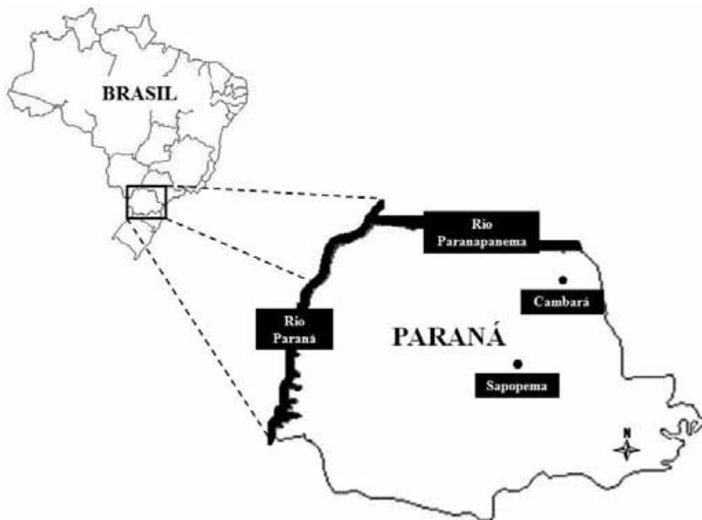
Figura 2. Ubicación de los lotes de reproductores de P. mesopotamicus y de los ríos Paraná y Paranapanema en el Estado del Paraná, Brasil. (Localization of the P. mesopotamicus broodstocks and of the Paraná and Paranapanema Rivers in the Paraná State, Brazil).

Para extraer el ADN se utilizó la metodología descrita por Bardakci y Skibinski (1994), modificada por Povh et al. (2005). Fragmentos de aleta caudal de aproximadamente 0,5 cm 2 y larvas enteras se colocaron en micro-tubos con 550 µl de tampón de lisis