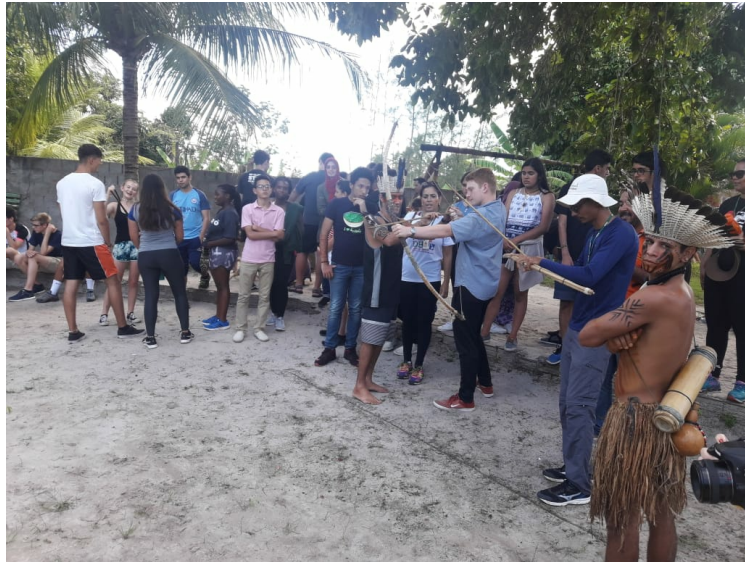
Figura 1 - Oficina de arco e flecha no restaurante Olho do Catu.