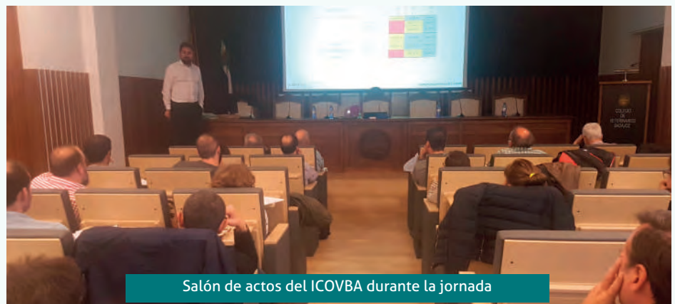
Salón de actos del ICOVBA durante la jornada