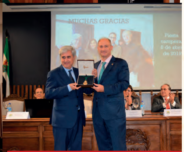
Entrega de Medalla de Oro y Diploma Acreditativo