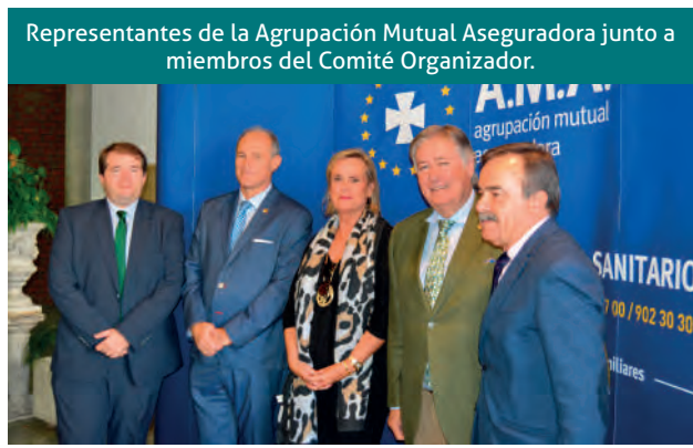
Representantes de la Agrupación Mutua Aseguradora junto a miembros del Comité Organizador.