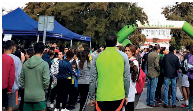
III Carrera Popular por la Salud 2019