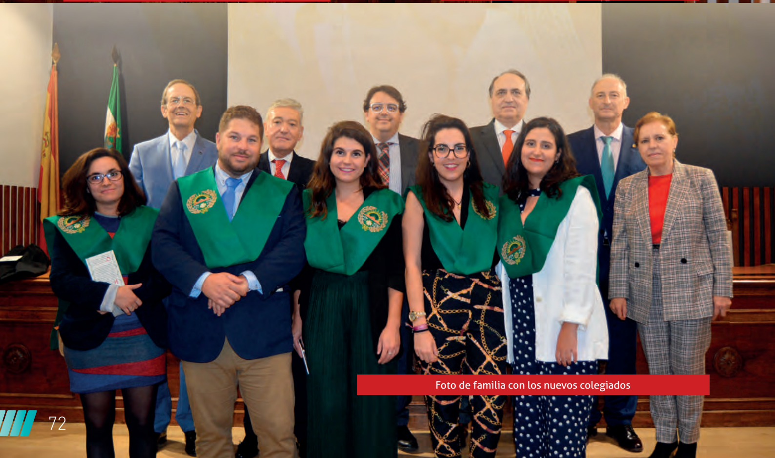
Foto de familia con los nuevos colegiados