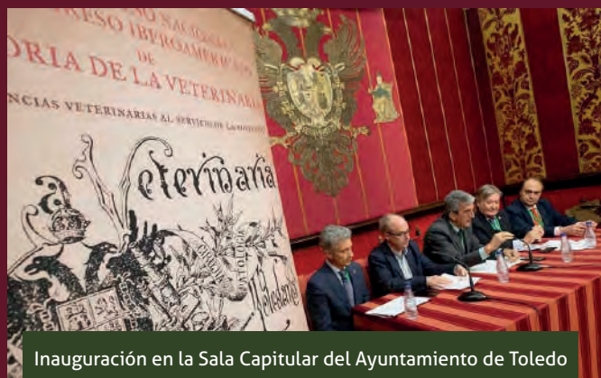
Inauguración en la Sala Capitular del Ayuntamiento de Toledo