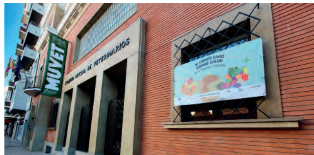
Fachada del ICOVBA. "Si comes sano ganas salud"