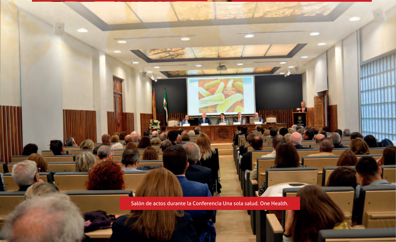
Salón de actos durante la Conferencia Una sola salud. One Health.