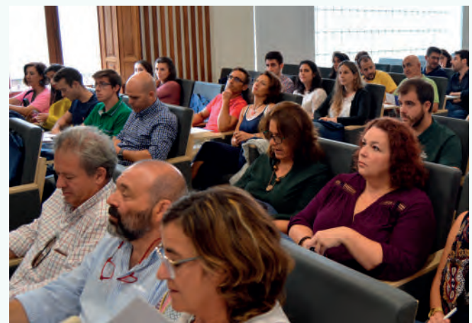
Alumnos durante la jornada