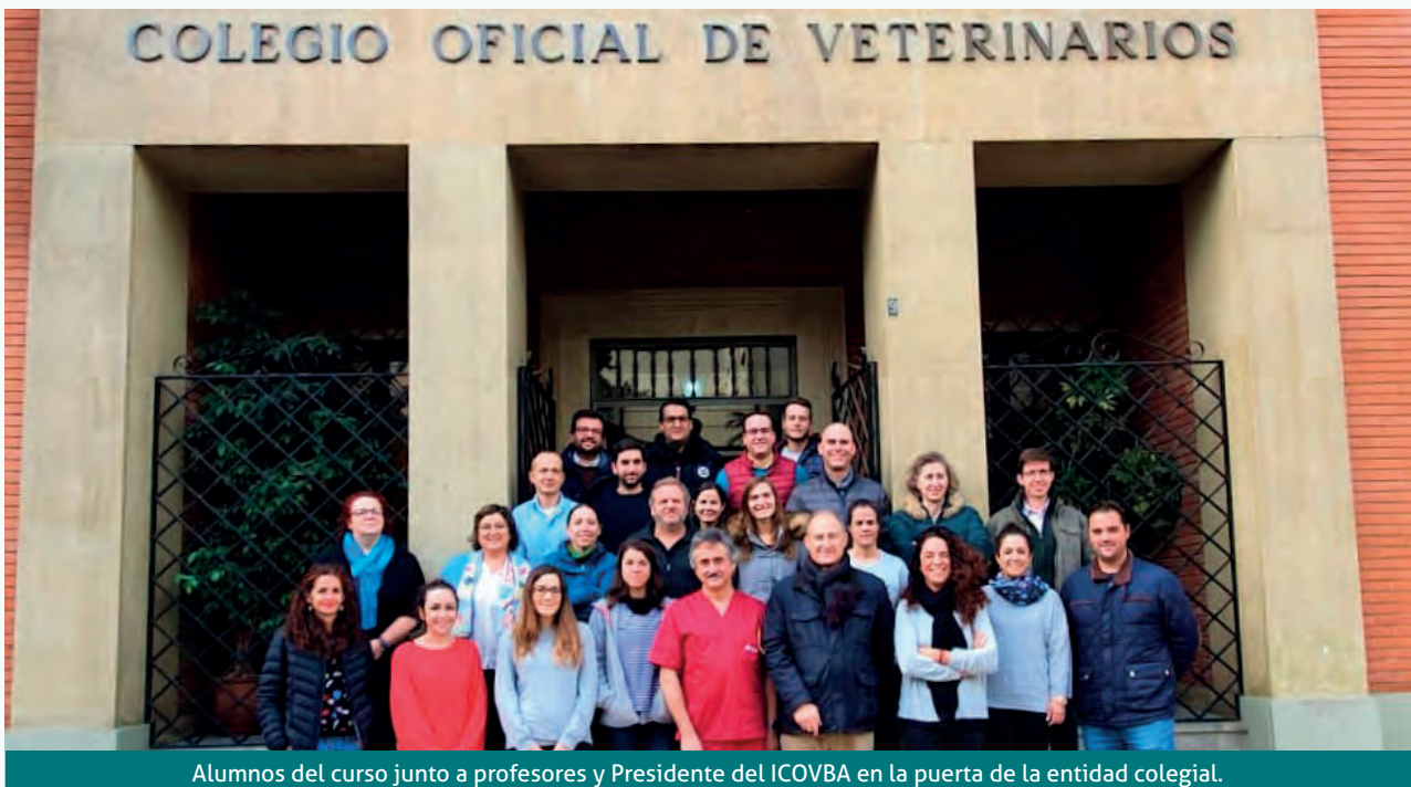
Alumnos del curso junto a profesores y Presidente del ICOVBA en la puerta de la entidad colegial.

Muy completo, son unos estudios valorables en todo el espacio de educación superior europeo con 30 créditos ECTS, correspondiéndose cada crédito con 25 horas de trabajo repartidas entre la parte presencial teórico - práctica, la participación en los casos clínicos y el Journal Club, donde se estudian y comentan más de 100 artículos publicados recientemente en revistas veterinarias de interés clínico.