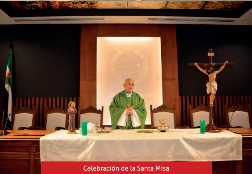
Celebración de la Santa Misa