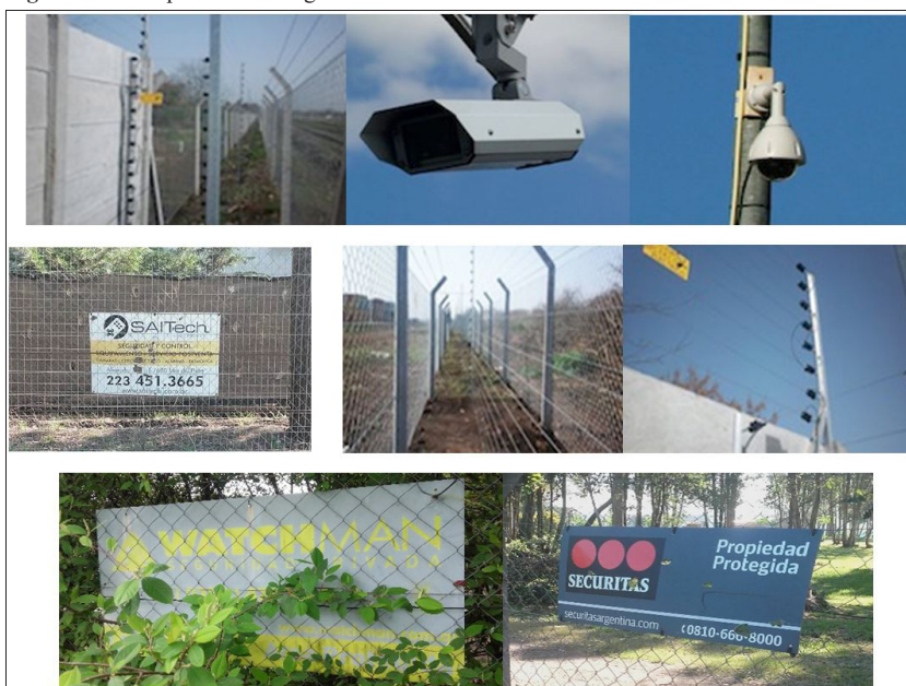
Figura N° 4. Dispositivos de seguridad