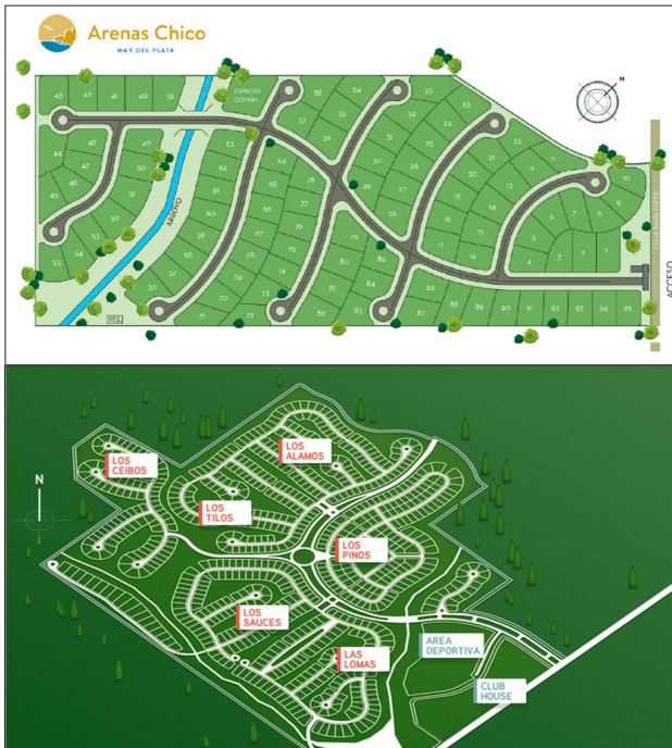
Figura N° 3. Plano de los loteados en Rumencó y Arenas Chico