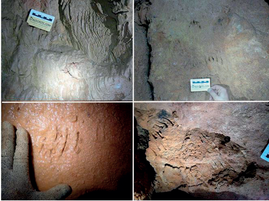
Figure 2: Bear claw marks in the walls of the Algar do Vale da Pena, Portugal. Scale bar is 7 cm.

Carvalho, 2018) and large hibernation beds made by bears have been observed and communicated to us by speleologist in the Almonda cave system.