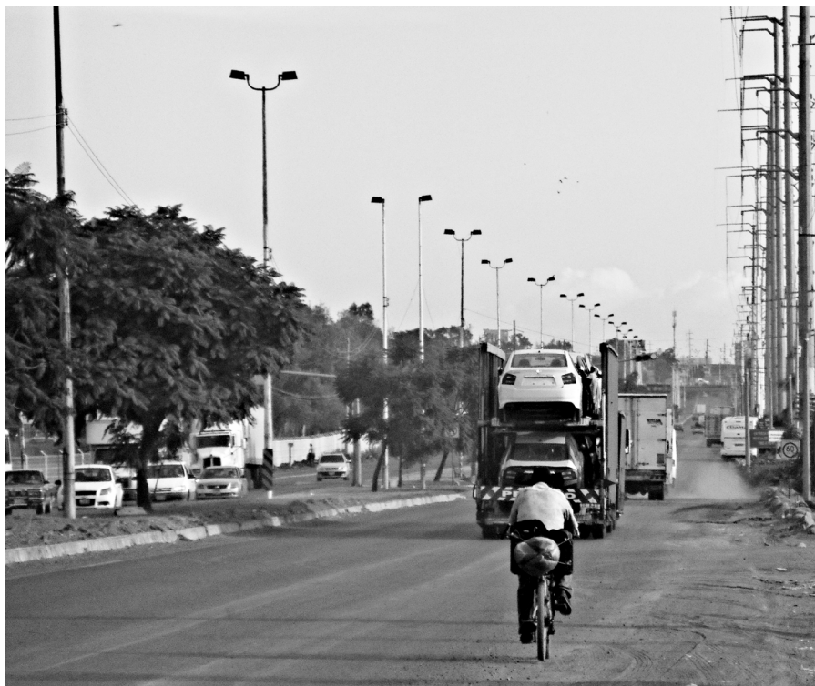
Figura 2. Ciclista en medio del tráfico del Corredor Industrial de El Salto.