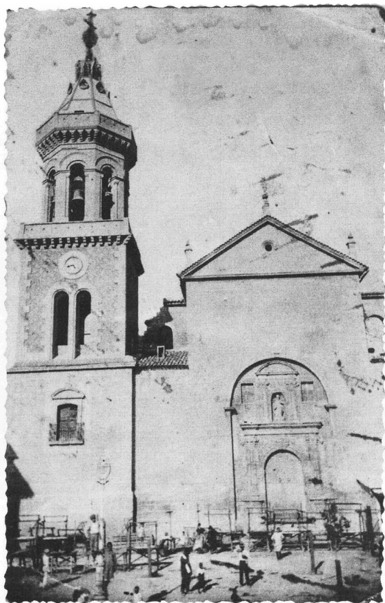
Fachada Principal de la Basílica de Nuestra Señora de la Asunción