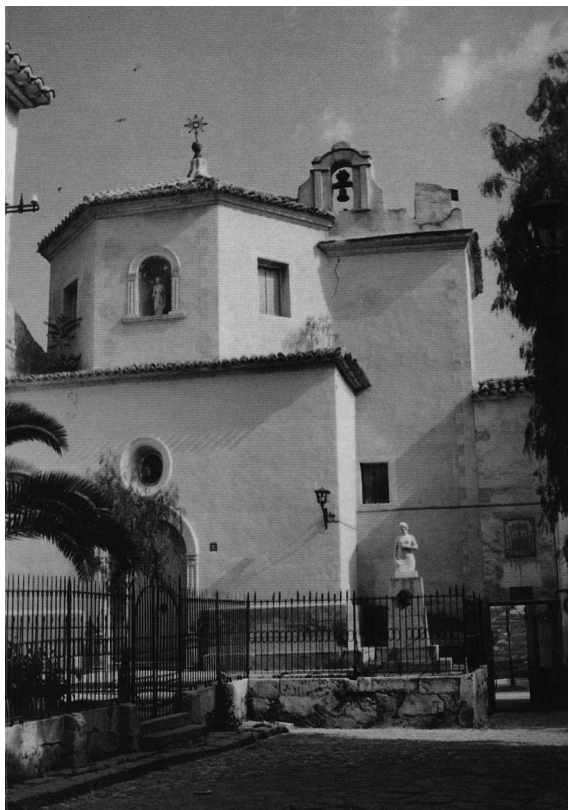
Ermita de San Bartolomé de Cieza durante el siglo XX

En la villa de Cieza, también encontramos otro ejemplo de la mencionada estructura arquitectónica, como es la cúpula que cubre el crucero de la Basílica de Nuestra Señora de la Asunción, donde se puede apreciar la función estructural que desempeñan estos elementos denominados pechinas, cuyo origen parece encontrarse en el mundo bizantino, y en concreto, en la Basílica de Santa Sofía de Constantinopla 7 , actual Estambul, aun cuando su resultado en un primer momento fue fallido, por haberse producido el desplome de su cúpula hacia el centro del edificio, lo que motivó la necesidad de construir una nueva cúpula, y dotarla de un sistema de nervaduras para que su peso no recayera únicamente en las pechinas, y así evitar que pudiera volver a desplomarse. Sin embargo, este sistema aplicado finalmente en la Basílica de Santa Sofía de Constantinopla, no fue necesario utilizarlo en la ermita de San Bartolomé, así como tampoco en el crucero de la Basílica de Nuestra Señora de la Asunción, posiblemente debido a que las dimensiones de estas, eran menores que las empleadas en la cúpula de la Basílica de Santa Sofía de Constantinopla.