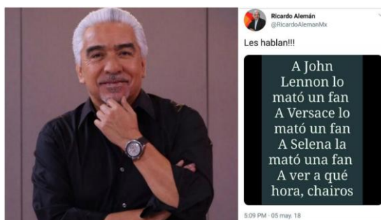
Imagen 1. Periodismo sicario