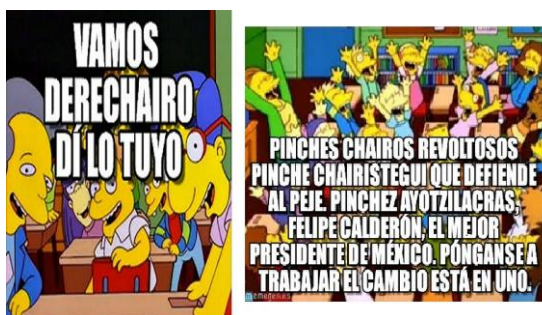
Imagen 3. Las contrapartes periodísticas