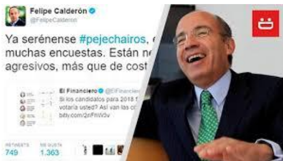
Imagen 2. Las ocurrencias de don Felipe

Ser de izquierda intentó ser presentado como inadmisibles en el contexto del México del siglo XXI a través de discursos progresistas de diferentes actores del PRI, PAN y PRD, que intentaron dividir a la coalición Juntos haremos historia mediante la promoción de un individualismo a ultranza que debilitara las acciones grupales y colectivas. La promoción del término chairo no fue suficiente para frenar las quejas, demandas y necesidades de millones de mexicanos que compartían en sus redes sociales las ideas de AMLO y que contestaban con agudeza las provenientes de los bots al servicio del sistema.