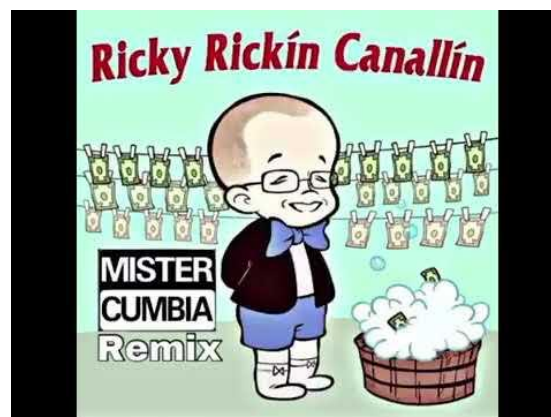
Imagen 5. Torbellino de memes