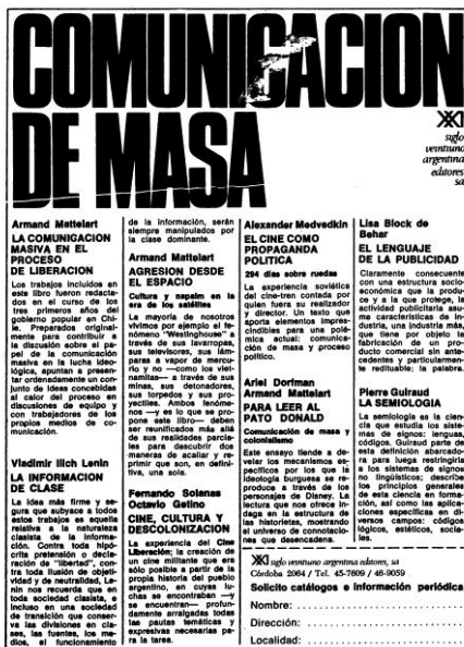
Títulos de la colección Comunicación de Masa .

En efecto, en “Donald y la política” Schmucler ubicaba la génesis del texto en los debates culturales de la llamada vía chilena al socia-