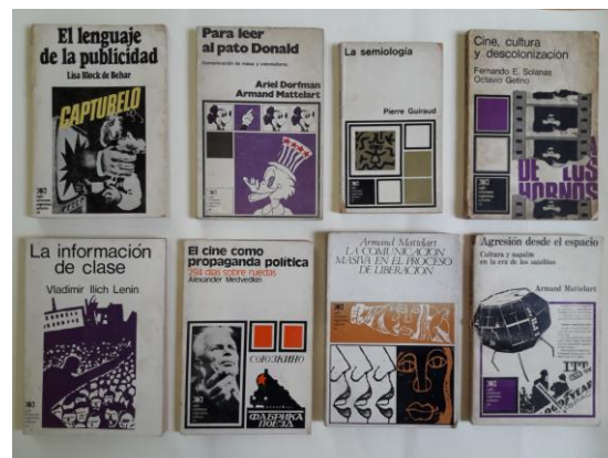
Portadas de títulos de la colección Comunicación de Masa

número de Comunicación y Cultura — y, como veremos enseguida, las prácticas cinematográficas y reflexiones sobre el cine militante que promovían Fernando Solanas y Octavio Getino, que serían reunidas en un volumen para Comunicación de Masa 10 .