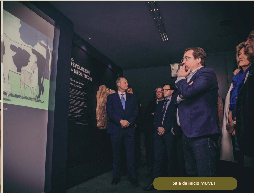
Sala de inicio MUVET