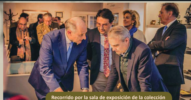
Recorrido por la sala de exposición de la colección permanente.