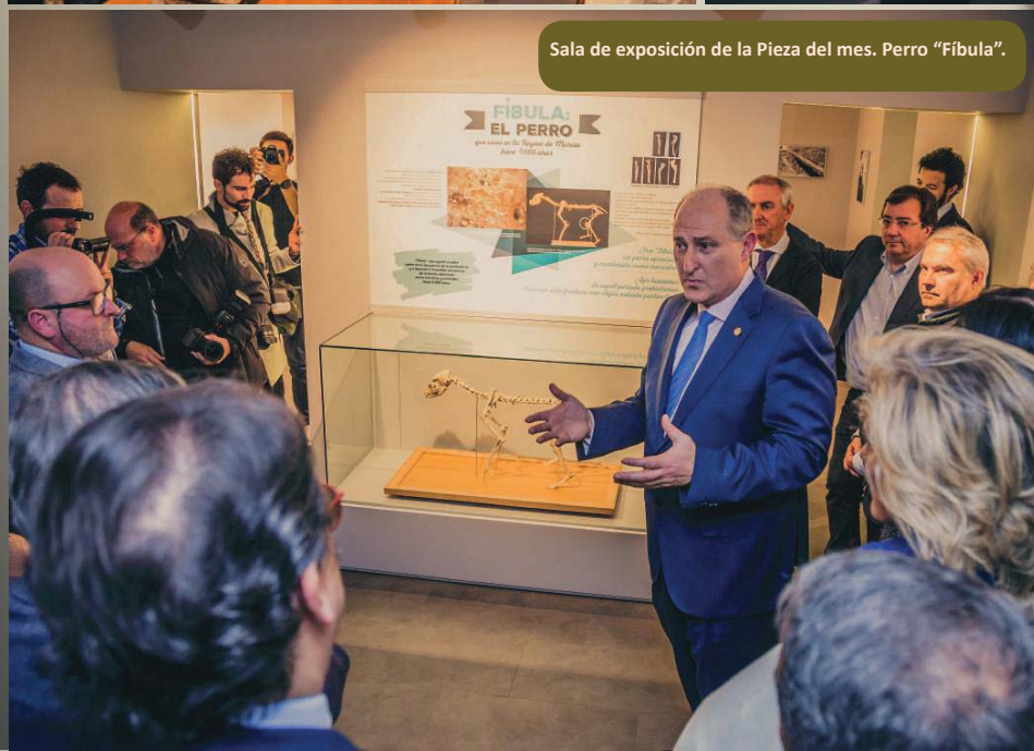
Sala de exposición de la Pieza del mes. Perro "Fíbula".