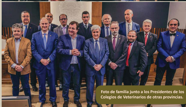
Foto de familia junto a los Presidentes de los Colegios de Veterinarios de otras provincias.