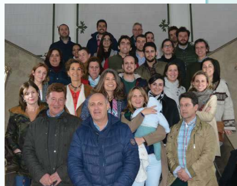
Profesoras y alumnos del curso