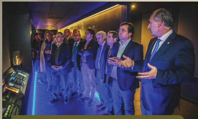
Recorrido por la historia de la profesión veterinaria.