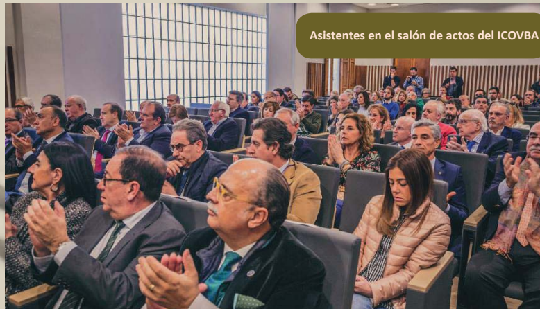
Asistentes en el salón de actos del ICOVBA