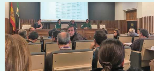
Elección de localidades