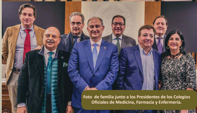
Foto de familia junto a los Presidentes de los Colegios Oficiales de Medicina, Farmacia y Enfermería.