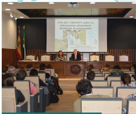
Inauguración del Curso de Etiquetado

Durante las sesiones se trataron los siguientes contenidos; El Reglamento (UE) N o 1169/2011 del Parlamento Europeo y del Consejo de 25 de octubre de 2011, el Real Decreto 126/2015, de 27 de febrero, por el que se aprueba la norma general relativa a la información alimentaria de los alimentos que se presenten sin envasar para la venta al consumidor final y a las colectividades, de los envasados en los lugares de venta a petición del comprador, y de los envasados por los titulares del comercio al por menor. Las particularidades del etiquetado en la carne y productos cárnicos, las particularidades del etiquetado de lácteos y productos lácteos y frutas y hortalizas y de igual modo las particularidades del etiquetado de la pesca y productos de la pesca y por último de la miel. A lo largo del curso se realizaron pequeños casos prácticos reales y resolución de dudas, resultando un curso muy participativo. Reconocido de Interés Sanitario por la Consejería de Sanidad y Acreditado con 2 créditos por la Comisión de Formación Continuada de las Profesiones Sanitarias del Sistema Nacional de Salud.