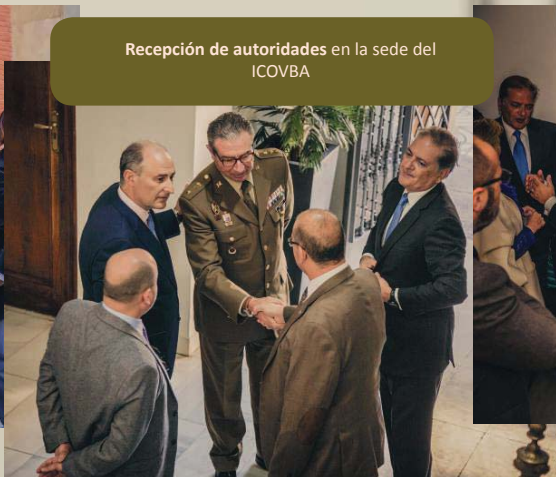
Recepción de autoridades en la sede del ICOVBA