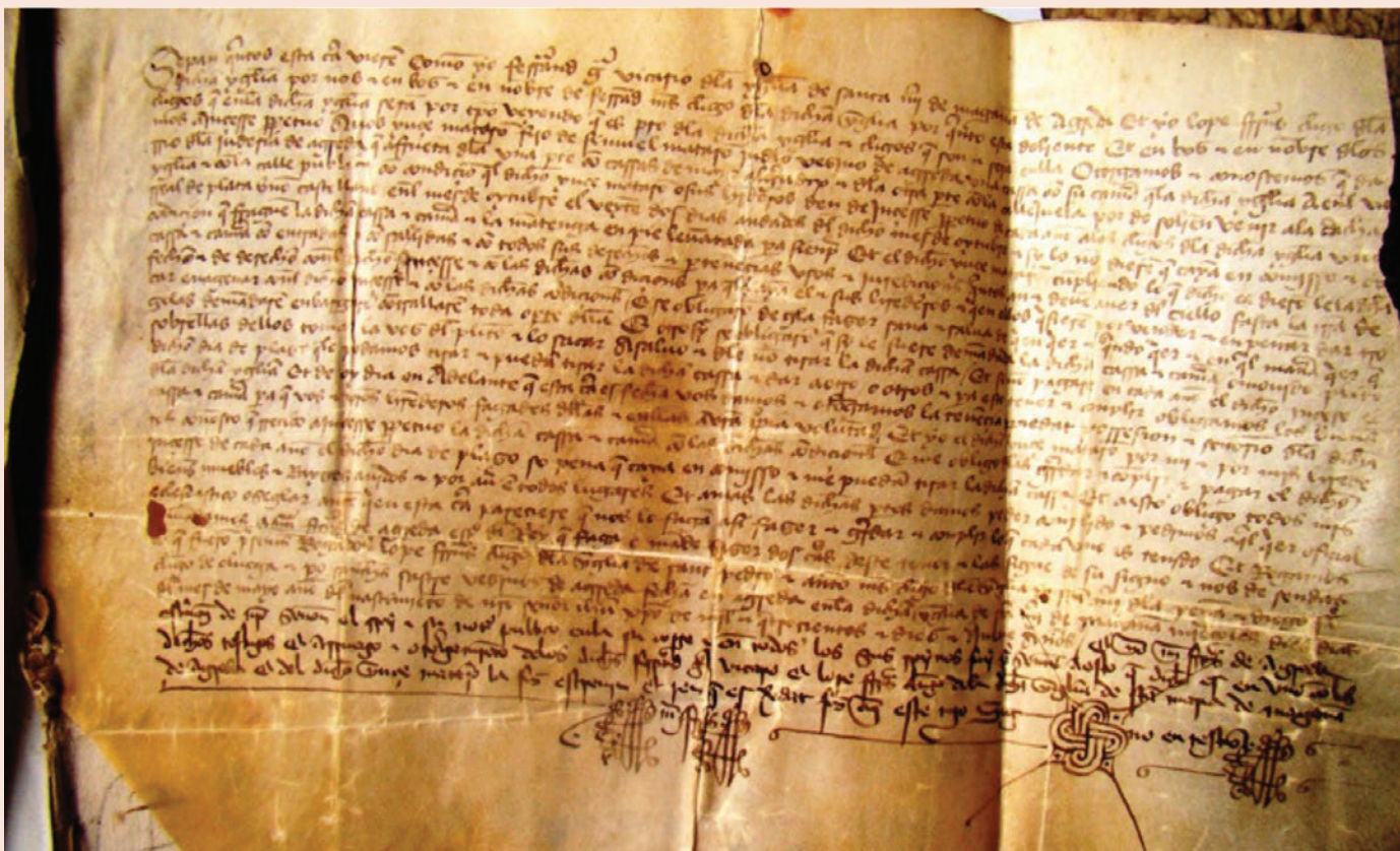
Contrato de arrendamiento de una casa en la Judería de Ágreda

(3) clérigos que en la dicha yglesia serán por tiempo, veyendo que es pro de la dicha yglesia e clérigos que son e serán en ella: Otorgamos e