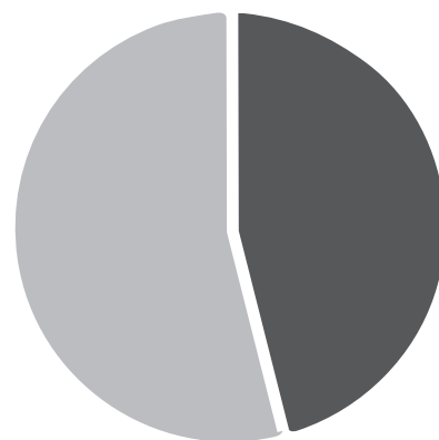
Gráfico 1. Resúmenes con resultados y sin ellos

En el gráfico 1 puede apreciarse que para los dos países los resúmenes que muestran resultados (área más oscura) son menos de la mitad.