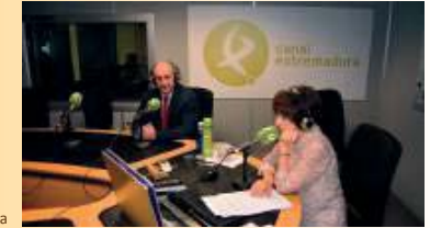
Durante la entrevista

El presidente del ICOVBA, llevó a cabo una entrevista radiofónica para Canal Extremadura, donde alertó que la región debe estar mejor preparada para afrontar y controlar la llegada de vectores artrópodos (mosquitos, garrapatas, piojos y pulgas...) transmisores de enfermedades humanas y animales, que comienzan a tener ya incidencia en otras comunidades. Recordó que hay que tener conocimiento sobre esta materia para poder prevenir futuros casos.