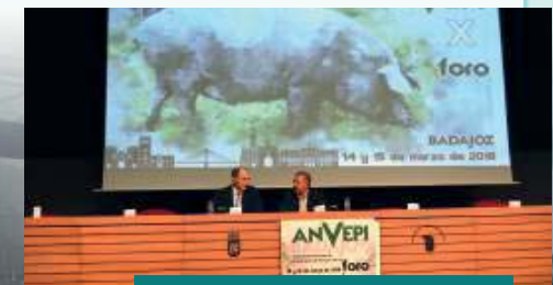
Clausura del X Foro ANVEPI