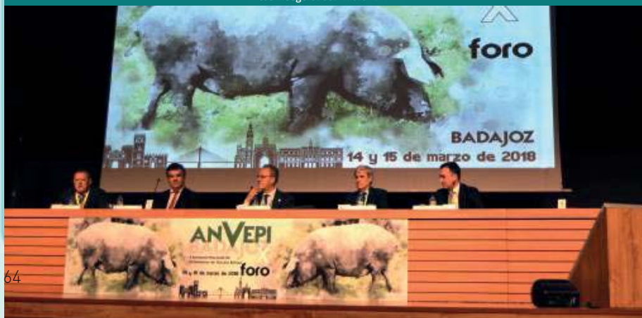
Mesa Inaugural del X Foro ANVEPI

Cabe señalar el avanzado Programa Científico compuesto de comunicaciones con un contenido muy variado y actual de temas sobre el porcino ibérico, tales como la innovación en la industria alimentaria, las nuevas tecnologías aplicadas a los productos del cerdo ibérico, los nuevos enfoques en el control de las diarreas neonatales, el control eficaz en la enfermedad de Glasser o el diagnóstico de enfermedades parasitarias en el cerdo ibérico. De igual modo se han expuesto por especialistas los datos productivos actuales sobre la raza Ibérica y la raza Ibérica Alentejana, sobre el manejo en lechones, las mejoras en la premontanera y el futuro de la Dehesa- Montado.