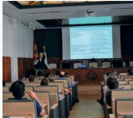
Asistentes durante la celebración del curso