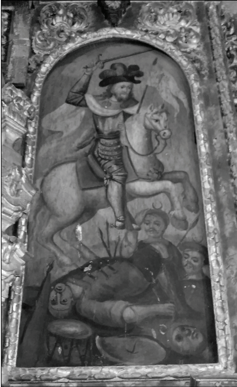
2. El Apóstol Santiago capitaneando las huestes cristianas, según representación pictórica contemporánea a los pleitos de los concejos alpujarreños. Retablo Mayor de la Iglesia de Bayacas, pedanía de Orgiva (Granada).