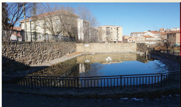
El estanque o pesquera durante muchos años fue lavadero p3blico.

En todas las visitas se hace referencia a la ocupaci3n, por parte del Ayuntamiento de la Villa de 3greda, « desde tiempo inmemorial », de un prado de la Encomienda que lo hab3a anexionado a la Dehesa y tamb3en haber construido unos corrales pegados a la Ermita, as3 como que el « estanque