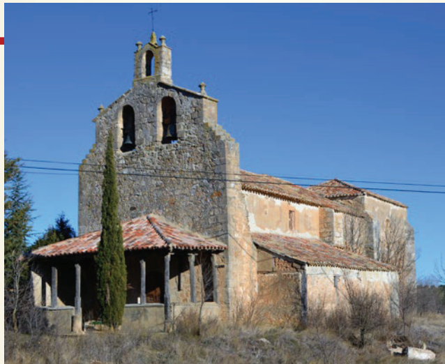
Iglesia de Hortezueta (Soria) que pertenecía a la Orden de los Hospitalarios.

Que aunque luego resulta que las que tres ermitas tituladas una de San Juan de Atienza, San Martín de Rubiales y Santa Cruz de la Villa de Agreda, lejos de traer utilidad a la Encomienda le son gravosas, como para su demolición es necesaria la licencia de S. A. Eminentísima, a fin de conseguir esta y que al mismo tiempo resuelva lo conducente en cuanto a la usurpación del terreno inmediato a la citada Ermita de Santa Cruz, podrá el Tribunal dar Comisión a la persona que tuviese por conveniente para que reciba información de testigos imparciales, que declaren el estado actual de las tres ermitas, su inutilidad, gravamen que de su subsistencia resulta a la Encomienda, que la ha de sostener, y las que ventajas que lograra está en su demolición, como también qué terreno es el que se ha ocupado junto a la Ermita de Santa Cruz por los que se dicen intrusos, de cuánto tiempo a esta parte y qué utilidad podría tener en ello la Encomienda.