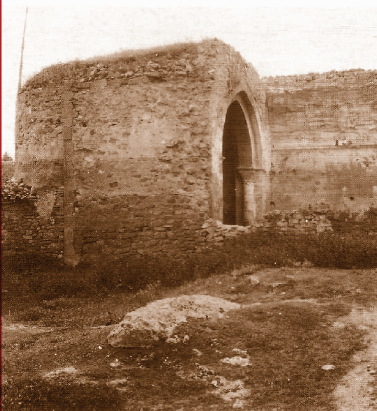
La ermita de Santa Cruz se mantuvo en completo abandono hasta su total destrucción en 1970.