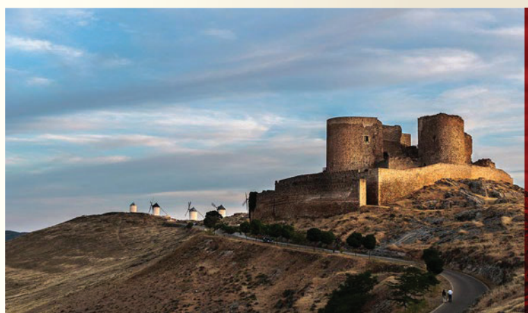
Castillo fortaleza de Consuegra.

El d3a 3 de mayo acud3an, a la Ermita de Santa Cruz, en procesi3n el Ayuntamiento y el Cabildo de la Villa, donde se celebraba una misa.