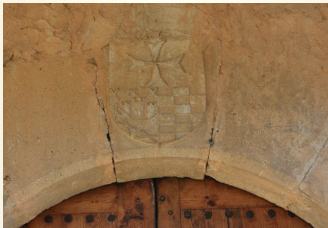
Escudo de la Orden sobre la puerta de entrada de la iglesia de Hortezueta (Soria)