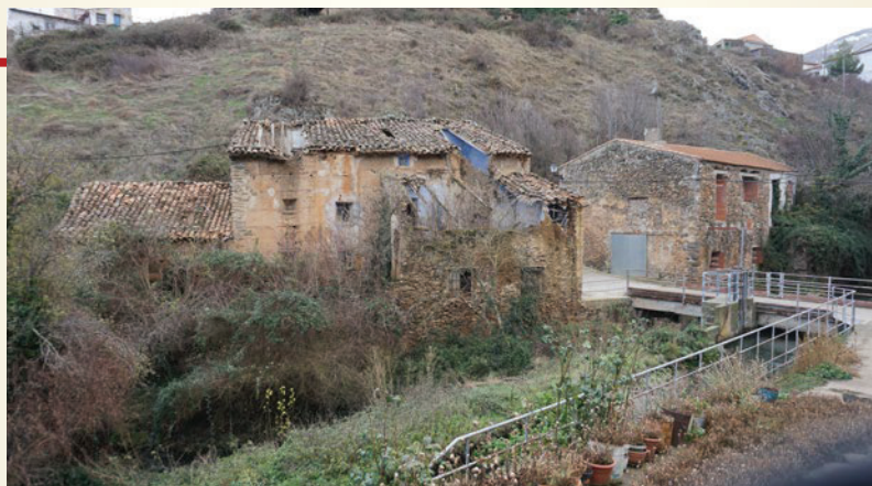
Ruinas de la posada y martinete de Vozmediano.

este tiempo se saca y mediante golpes se va despojando de la escoria e integrando el hierro. Esta función se realiza mediante un gran martillo o mazo que suele ser movido hidráulicamente, el molinete.