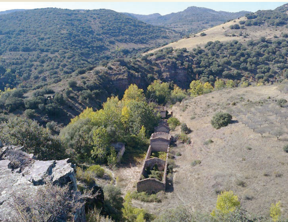
Fundición de la mina de Valdeplata, Calcena.