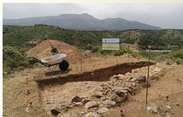
Excavaciones arqueológicas de Los Fayos han permitido documentar un asentamiento de 2.600 años y estudiar las fortificaciones medievales de época cristiana.

No vamos sino a aludir de pasada a esta minería reciente, ya conocida y frecuentada en nuestros estudios y revivida con la iniciativa de una nueva explotación de magnesita en Borobia actualmente; tampoco nos remontaremos, salvo para tomar impulso, a las épocas antiguas, celtíberas o romanas. Nuestro ánimo es acotar el fenómeno económico de la explotación de los minerales del Moncayo en el segmento temporal de finales del siglo XV y principios del XVI y conectarlo con la política del momento, con dos actores principales: los descendientes de Juan Ruiz de Ágreda, Diego Castejón y sus hijos, enfrentados a Lope de Valdivieso y después a Alonso, su hijo, alcaldes de Sacas de las cosas vedadas de nuestra aduana.