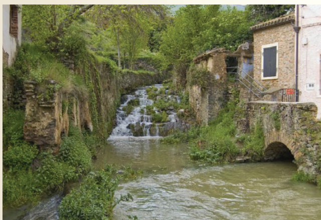
Rio Queiles, Vozmediano.