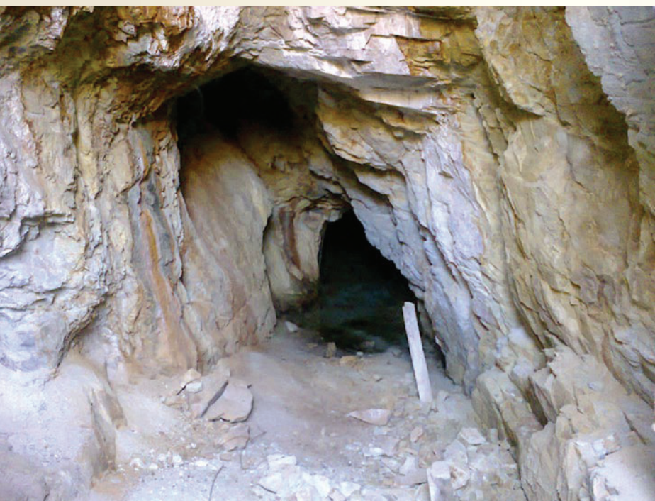
Galería de la mina de plata, Calcena.

arqueológico del “Plano del Cerro”, que data del año 500 o 600 antes de Cristo, es un buen comienzo para significar cómo y por qué se asentaron en torno al Moncayo nuestros antepasados, las excavaciones y estudios se deben al arqueólogo turiasonense Óscar Bonilla.