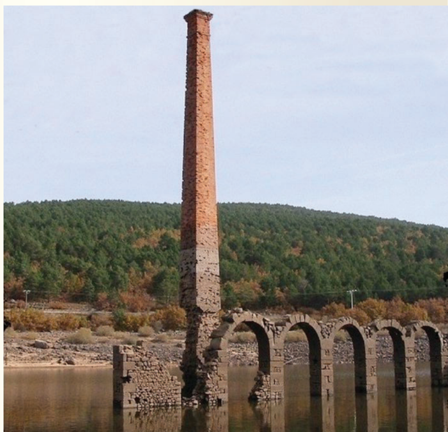
Ferrería La Numantina, Vinuesa, ruinas en el Pantano de la Cuerda del Pozo.