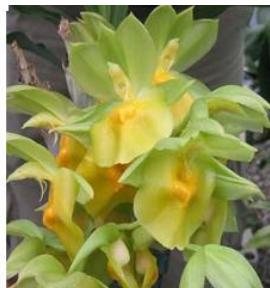
Figura 3. Catasetum expansum .