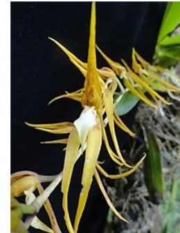
Figura 10. Brassia jipijapensis .