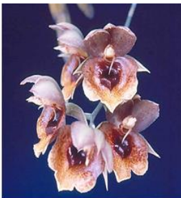
Figura 2. Catasetum Expansum .

Lokhartia sp. y Campylocentrum sp. fueron recolectadas a 4 m en el bosque de Bahía de Caráquez. Las especies Umbrophilas, como Dimerandra rimbachii y Notylia sp., fueron encontradas en el estrato bajo del bosque (1.5 - 4 m), pero en el estrato alto a Cattleya sp. en el bosque de Bahía de Caráquez, la cual se encontró a 8 m. Este individuo fue protegido de la luz solar por Cactáceas creciendo en las proximidades del árbol hospedero. En el bosque El Cerro 11 de 21 especies (52%) encontradas se consideran umbrophilas, mientras 3 de las 4 especies de orquídeas (75%) encontradas en el bosque de Bahía de Caráquez fueron heliophilas.