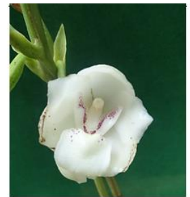
Figura 6. Peristeria elata .