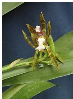
Figura 7. Aspasia psittacina .