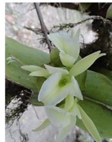
Figura 5. Epidendrum rhizomaniacum .