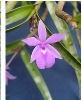
Figura 11. Dimerandra rimbachii .