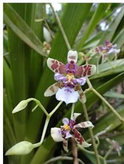
Figura 8. Cyrtochiloides riopalenqueanum .