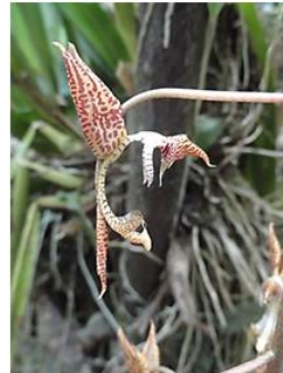
Figura 9. Gongora Grossa .