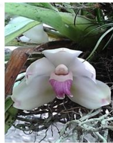
Figura 4. Pescatoria wallisii .