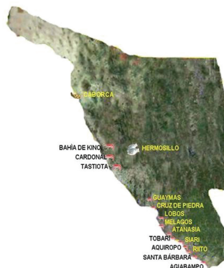
Figura 1. Ubicación de las regiones productoras de camarón de cultivo estudiadas