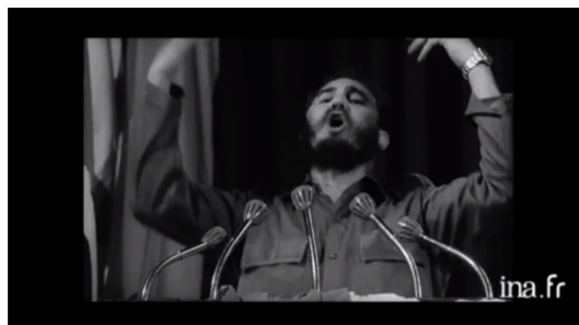
Figura 6. Fidel em primeiro plano no fim da edição 291.

que luchan, por los cuales está dispuesto a dar también su sangre. ¡Patria o muerte! ¡Venceremos! (Transcrição da edição 291 do Noticiero ICAIC Latino-americano)