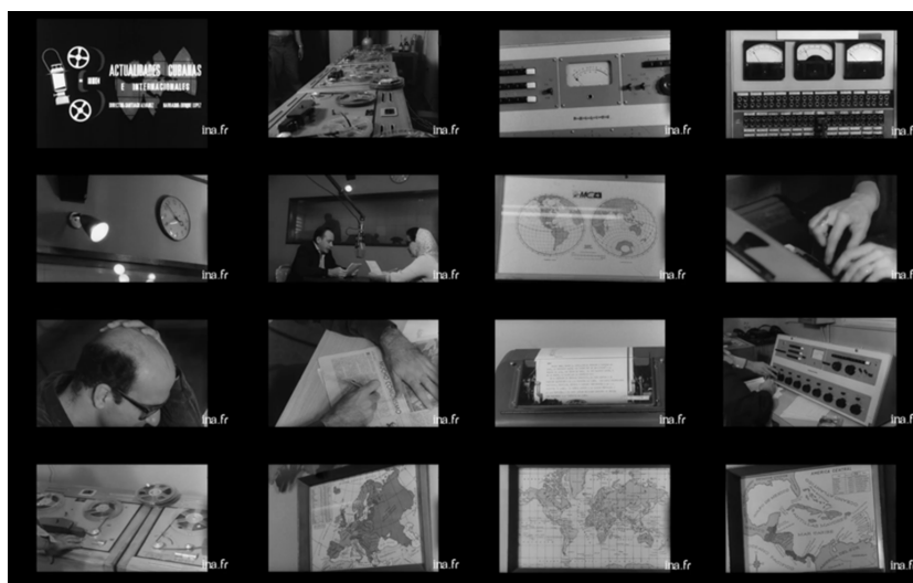
Figura 2. Sequência de Abertura da edição 291 do NIL.

A sequência “1” (Figura 2) começa com a melodia da Marcha al 26 de Julio (Agustín Díaz Cartaya), tocada como se fosse uma vinheta de rádio. Vêem-se grandes carretéis de fita magnética girando num gravador. Em seguida, uma voz feminina fala numa língua estrangeira e, no meio da locução, ouve-se em espanhol: “Radio Habana Cuba”. Concomitantemente a uma lâmpada cintilante, ouve-se mais uma frase da melodia da Marcha já citada. Em seguida, vêem-se trabalhadores da rádio, equipamentos e mapas fixados na parede ao som de uma música oriental – possivelmente do Vietnã 9 – e uma polifonia de vozes, em diversos idiomas, que se sobrepõem entre si. Em meio a esta paisagem sonora babélica, e em conjunção com a imagem de um mapa do Caribe fixado na parede, ouve-se a voz de Fidel Castro. Entre as imagens da rádio, na primeira sequência, e da plenária lotada, na sequência “2”, Castro profere as seguintes palavras: