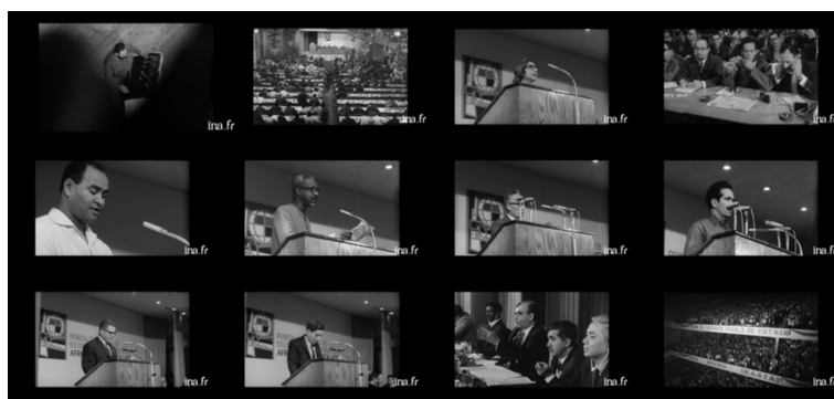
Figura 4. A voz de Fidel Castro cruza as falas das lideranças internacionais.