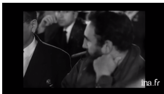
Figura 3. Desacusmatização de Fidel Castro na Sequência 3.

Voltando ao verbocentrismo, o fenômeno é mais evidente na segunda entrada da voz de Fidel, na sequência “4”, entre 00:04:35 e 00:07:00. Logo após a sequência que mostra a cerimônia de encerramento da Conferência dentro de um estádio e a festa na Plaza Vieja, no centro histórico de Havana, aparece Fidel Castro pela primeira vez. Seria algo próximo ao que Michel Chion denomina como desacusmatização (Chion, 2011: 104), isto é, a revelação da fonte sonora, no caso o dono da voz (Figura 3). Não obstante, só na sequência seguinte se vê a imagem de Castro falando para a mesma plenária que aparece na sequência “2”.