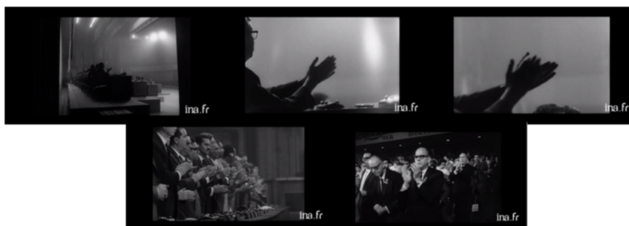
Figura 5. A ênfase nas palmas após Fidel declarar apoio dos cubanos ao movimento revolucionário mundial

Quando Castro afirma que todo o movimento revolucionário mundial pode contar com o apoio dos cubanos, ouvem-se palmas e se vêem imagens de mãos que são construídas com o uso de diversas escalas de planos, passando uma mensagem de um apoio unânime do auditório (Figura 5). Se, para Jane Gaines, a mimésis política é uma espécie de contaminação da audiência com as emoções presentes na tela, a ovação da plateia no encerramento da Conferência presume o apoio dos cubanos à Tricontinental ao assistir ao Noticiero nas salas de cinema do país. A própria retórica de Fidel Castro, no encerramento do evento, conjectura sobre a recepção dos cubanos aos povos amigos e como seguirá a relação a partir de então: