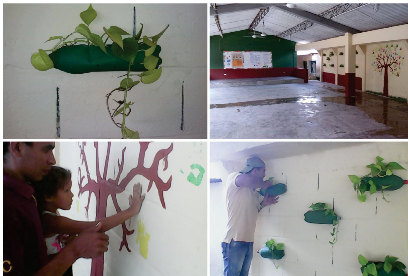
Imagen 4. Aula múltiple. Antes y después