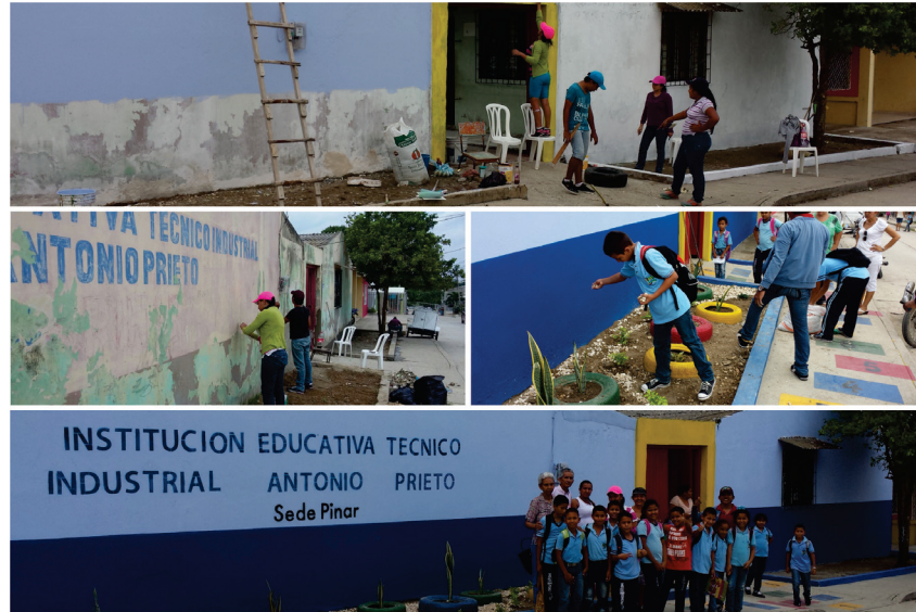
Imagen 1. Fachada principal de la Institución Educativa. Antes y después