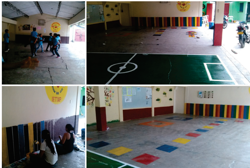
Imagen 3. Aula múltiple. Antes y después

La recuperación del aula múltiple se basó en el diseño de los jardines colgantes, los muros interactivos de estimulación 5 y el mural del árbol de la vida 6 con la idea de brindar apoyo moral a los estudiantes de la institución, hacerlos partícipes de la actividad y estimular el cuidado del área recuperada. La