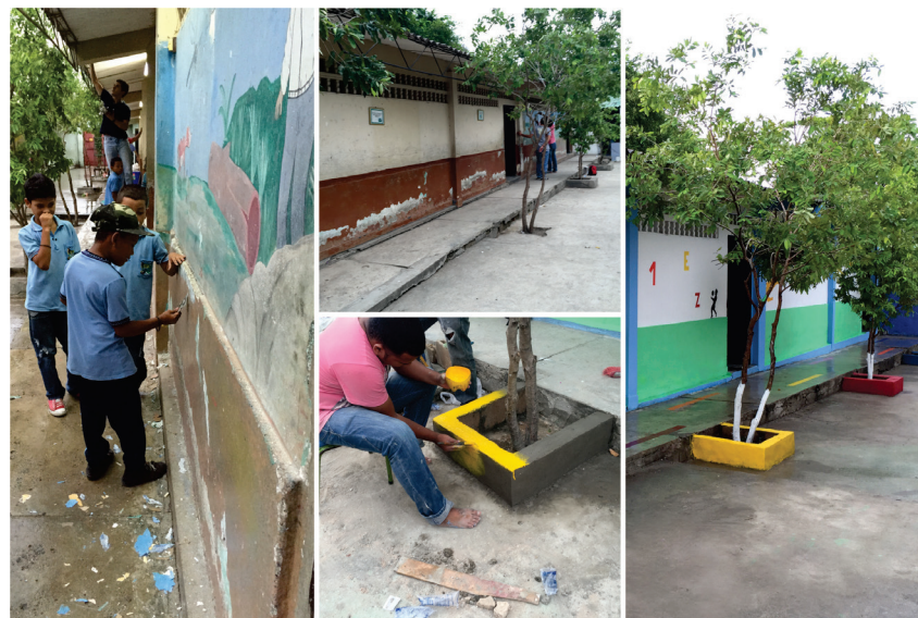
Imagen 2. Fachada de las aulas. Antes y después