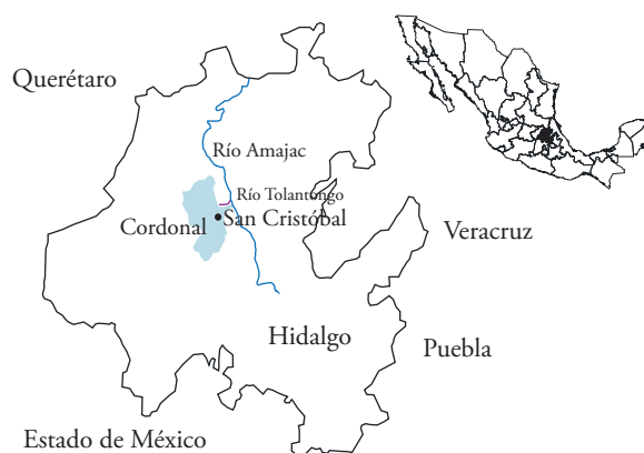
Figura 1. Ubicación de San Cristóbal.

San Cristóbal is a community of Otomí origin with ejido (shared land) property, located in the