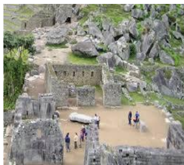
Templo de Cóndor