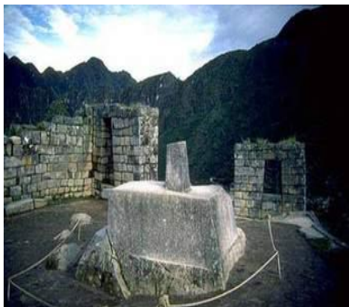
Templo del sol