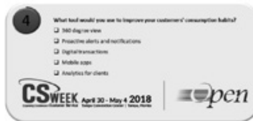
Figura 5 Respondiendo las preguntas de una trivia usando un elemento de juego (cronómetro)

En conclusión, se demuestra cómo los elementos de juego se pueden utilizar en los diferentes contenidos que el área de mercadeo de Open Systems Colombia SAS quiere implementar.