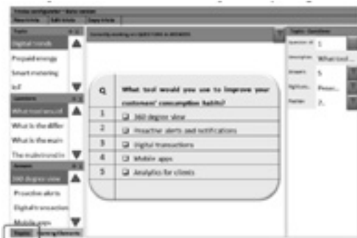
Figura 3 Configurador de trivias. Preguntas y respuestas

El configurador permite especificar los elementos de juego, los eventos de cada elemento y las acciones para cada evento, como se muestra en la Figura 4: