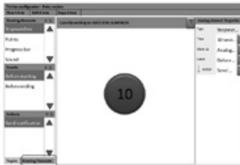
Figura 4 Configurador de trivias. Elementos de juego

La Figura 5 muestra que cada trivia creada con el configurador estará disponible para el área de marketing de Open Systems Colombia SAS, que se publicará como contenido dentro de su página web. En cada trivia los elementos de juego se mostrarán a los jugadores según como se hayan configurado. La Figura 5 refleja el uso de un cronómetro que apunta al jugador a elegir la respuesta correcta en un tiempo limitado.